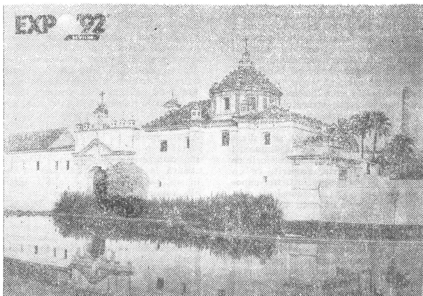
Mănăstirea Cartuja — centrul spiritual al Expoziției Universale de la Sevilla 1992.