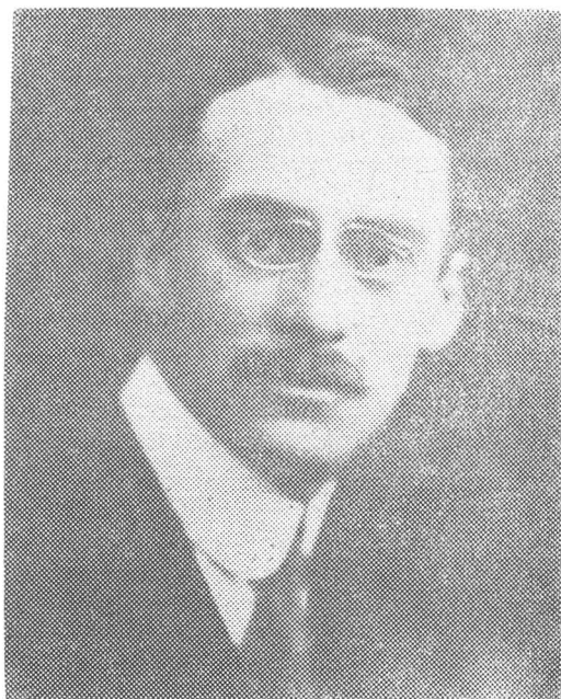
I.G. D. ca – fotografie din tinerețe.