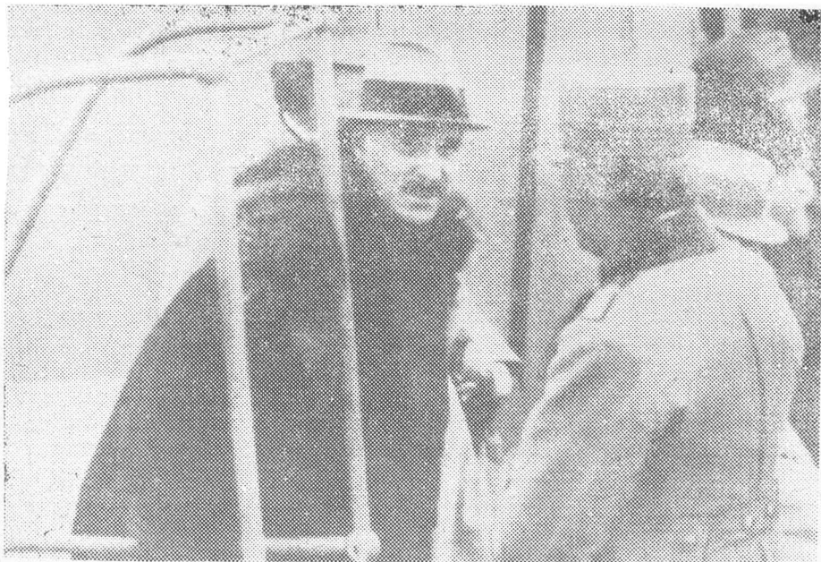
Pe un vapor francez.