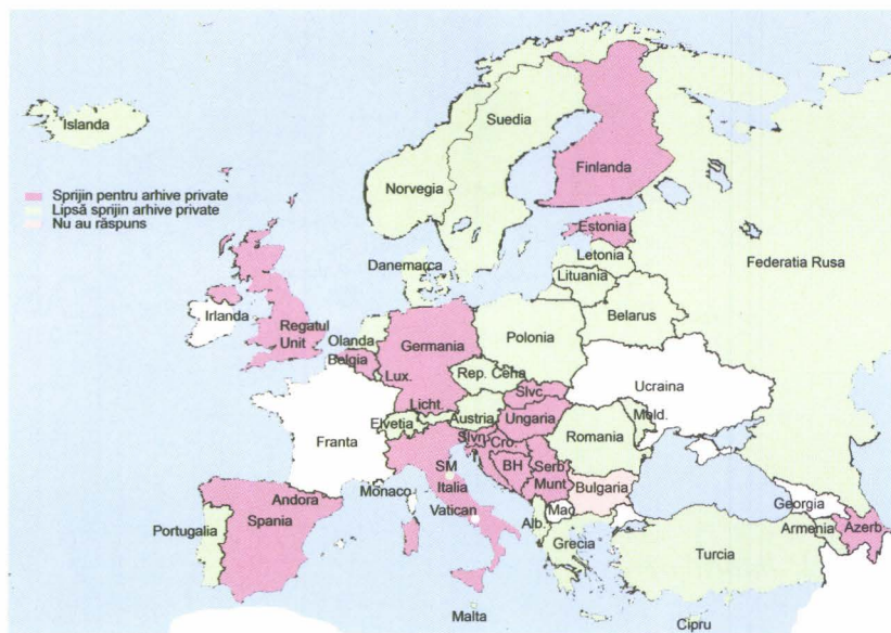
harta nr. 7