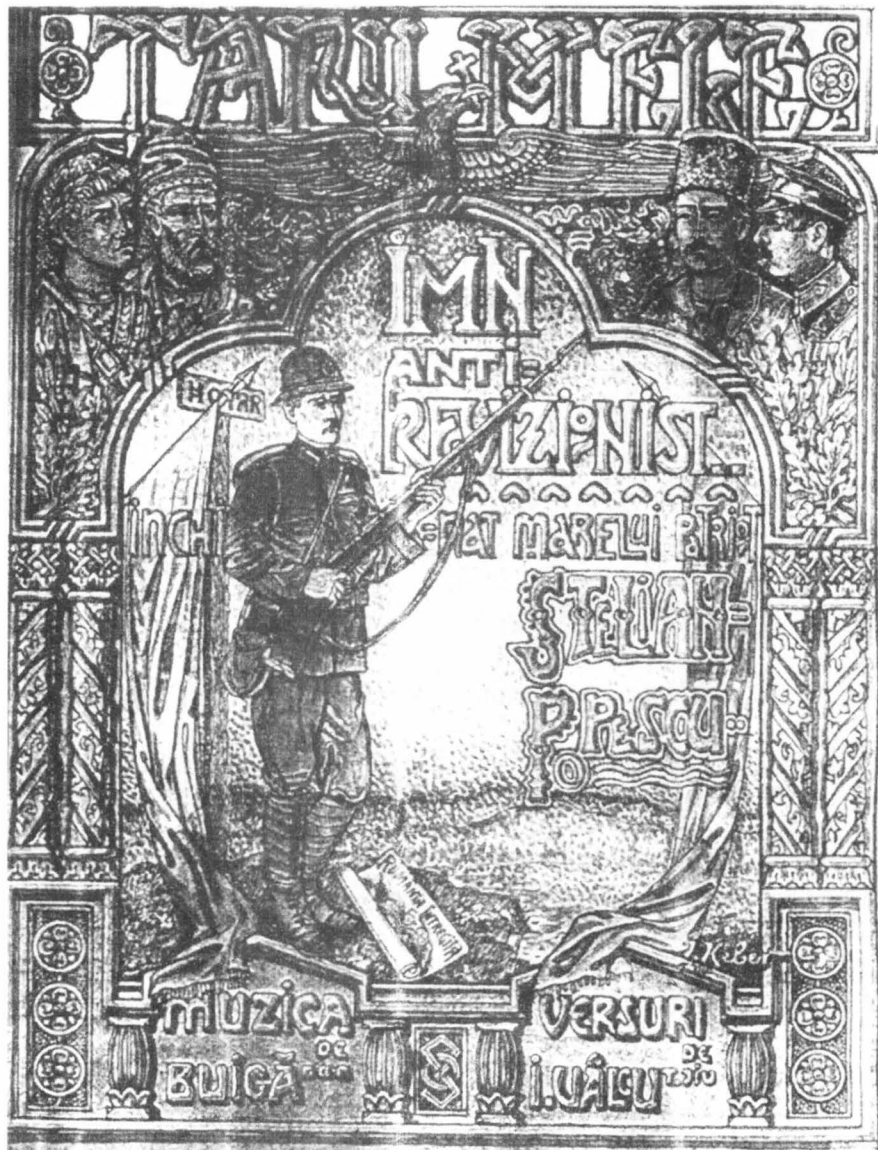
D.A.N.I.C., fond Liga Antirevizionistă Română , dosar 38, f. 7.