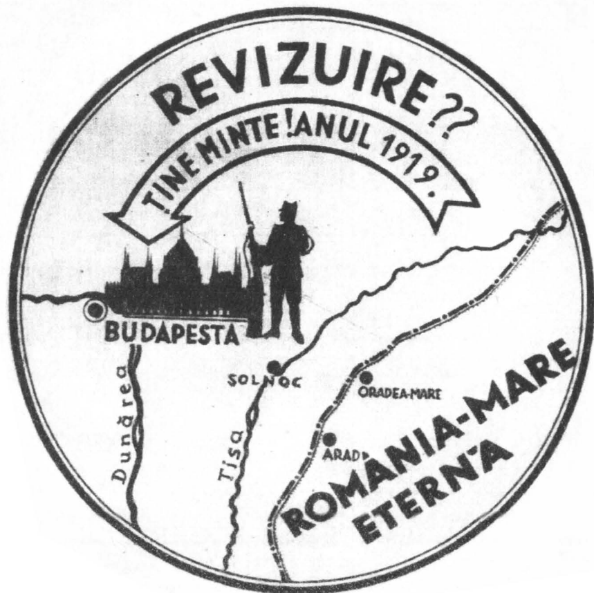
D.A.N.I.C., fond Liga Antirevizionistă Română , dosar 38. f. 12.