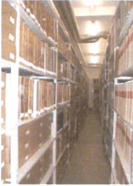
Image 1. Salle de dépôt

Ce projet, pionnier dans la Région, a aussi permis la réalisation d'un Web site et d'un moteur de recherche qui permet la consultation des documents numérisés et les rend accessibles à un plus grand nombre de personnes.