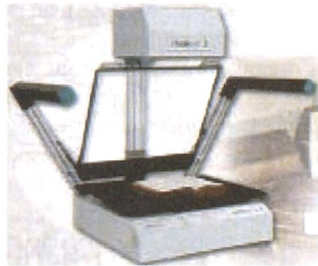
Image 5. Scanner A0 e scanner planétaire A2