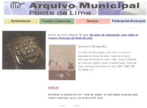
Image 2. Web site des Archives Municipales de Ponte de Lima