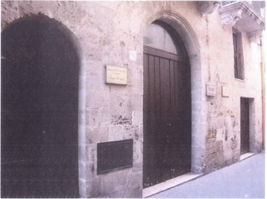
Present seat of Taranto Observatory at Via Duomo 181