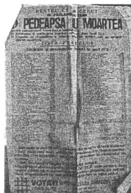
"De ce am cerut în Parlament pedeapsa cu moartea pentru trădătorii care manipulează banii publicii". Un afiș electoral din anul 1931.