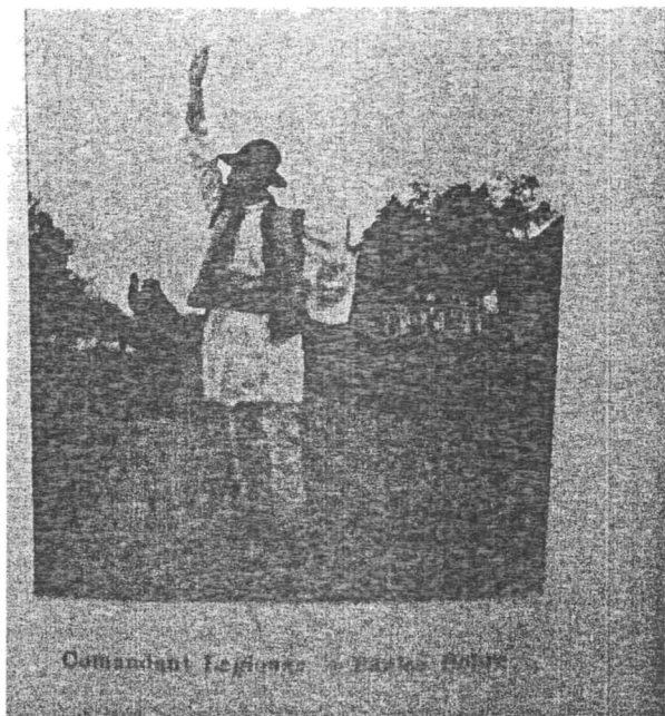
Comandant Legionar în Băile Bănele

localitățile rurale din primăvară până toamna. Autoritățile au descris în nenumărate rapoarte desfășurarea acestor marșuri propagandiste: în august 1933 au trecut elevi aromâni din Brașov prin satele din apropiere intonând cântece legionare.