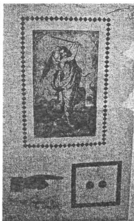
ANIC, DGP, ds. 239/1935 Afișe electorale din anul 1935

O analiză proprie merită și discursurile legionare, deoarece Legiunea a dezvoltat un limbaj pe înțelesul populației sătești. "Eu nu am auzit un orator de talia lui, pentru că nu poți vorbi maselor, țăranilor, nu poți vorbi abordând probleme de politică externă, sau știu eu, de filozofie, înseamnă să fii un caraghios! El avea darul să combine probleme de gospodărie personală, gospodărie județeană cu sentimentul religios al țăranului, care atunci era dominant", spune un legionar despre tatăl lui Codreanu 95 . Acest citat poate fi privit doar ca începutul unui fir roșu al cercetării; el