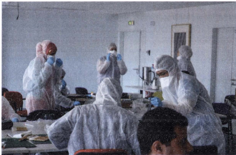
Arhivele Naționale ale Franței Desprăfuirea manuală

1) Manuală , și se realizează cu perii moi, textile care nu lasă fibre sau pensule. La fel ca măturarea, ea are inconvenientul de a răspândi (lăsa) praful în spațiul ambiental.