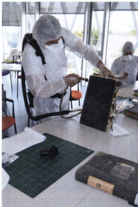
Arhivele Naționale ale Franței Aspiratorul portativ

2) Mecanică , se face cu ajutorul unui aspirator cu filtrare completă, care respectă normele HEPA ( High Efficiency Particulate Air filter ), prevăzut cu un variator de putere, pentru a nu distruge suportul documentului. Spre deosebire de aparatele de acest tip, care rețin complet praful, aspiratoarele casnice împrăștie microparticulele în aerul înconjurător. 14 Cel mai utilizat este aspiratorul portativ, care se pune în spate ca un rucsac.