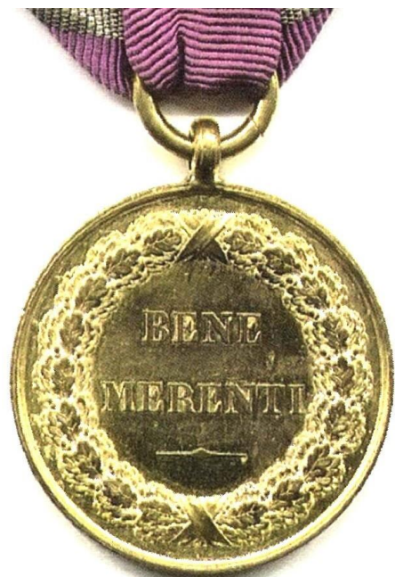
Medalia " Bene-Merenti " clasa I (avers și revers).