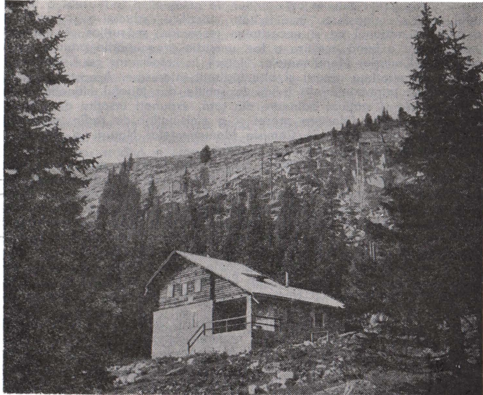
Casa-laborator Gemenele

turii din cadrul Academiei Republicii Socialiste România și Subcomisia Monumentelor Naturii de la Cluj, în colaborare cu Institutul central de biologie, Centrul de cercetări biologice din Cluj, Institutul de geografie al Academiei, Facultățile de biologie din Cluj și București. În ultimii ani aceste cercetări s-au realizat pe baza unor contracte de cercetare științifică.