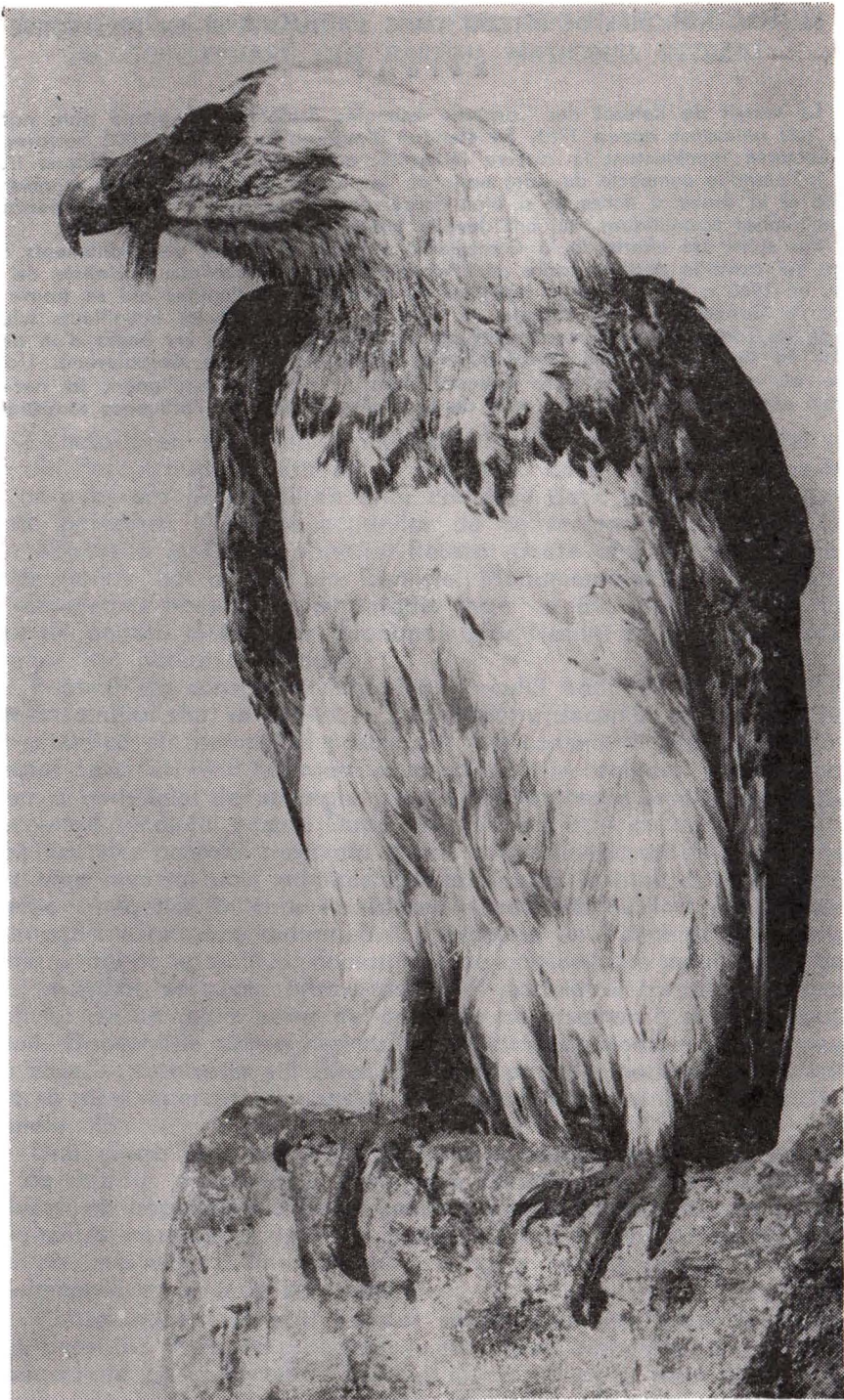
Zăganul ( Gypaëtus barbatus grandis ) în Muzeul Brukenthal din Sibiu