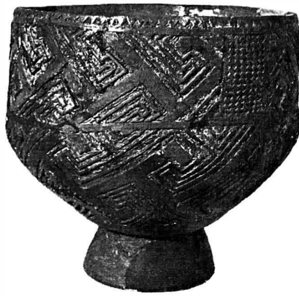
Pl. 1 Cupă rituală descoperită în sanctuarul Boian - Giulești final.