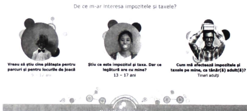
Figura nr. 1: Interfața platformei TAXEDU