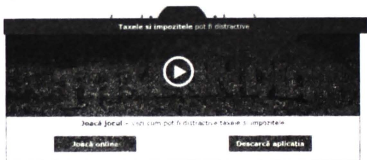
Figura nr. 4: Interfața platformei TAXEDU (jocul Taxalandia)

După folosirea acestei platforme la clasele de gimnaziu și de liceu, am constatat că, jocul rămâne favorit pentru toți elevii. Totuși, elevii de liceu au fost mai interesați de finalizarea lui, probabil și pentru că nivelul lor de înțelegere este mai mare.