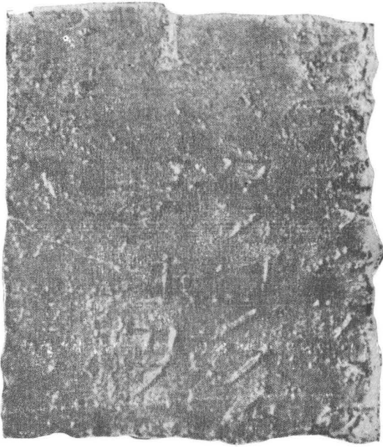
Fig. 2. — Buciumi. Fragment de diplomă militară ( intus ).