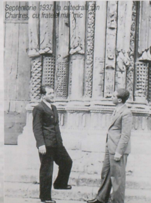
Septembrie 1937, la catedrala din Chartres, cu fratele mai mic

1940 – Reconstituie cu considerabile eforturi romanul Accidentul . Îl publică la Fundația pentru literatură și artă. Romanul, mai încheșat epic decât cele apărute anterior, este o dramă a solitudinii.