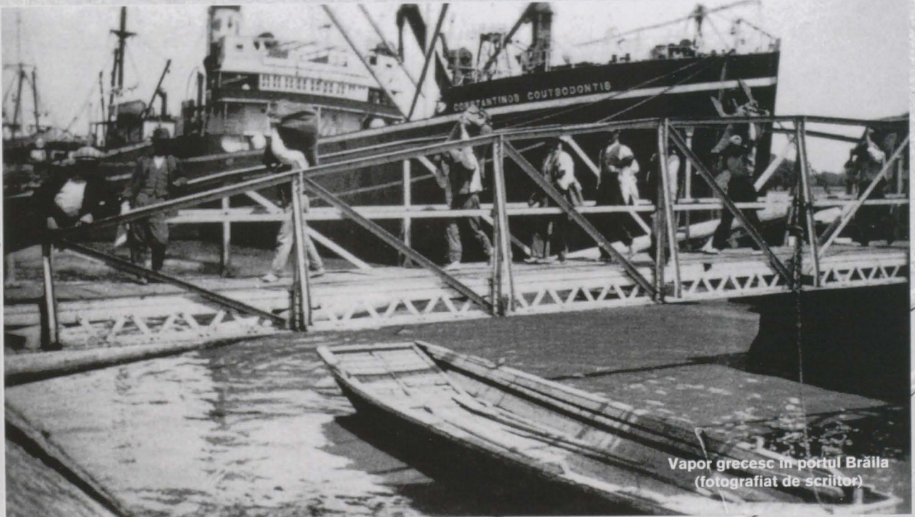
Vapor grecesc în portul Brăila

Împinge totul în fantastic. Analogii, coincidențe, simetrii; un fantastic adeseori la limita puerilității și a melodramaticului, dar cu atât mai neliniștitor: