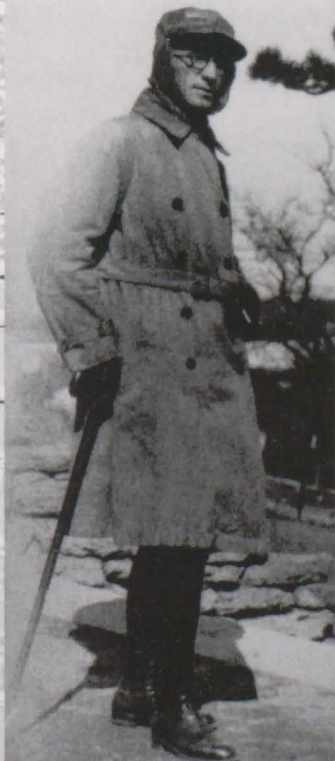
Gata de drum în Siberia

niciodată cuvintele, mă urmăresc și acum, ca un glas la o judecată din urmă: "Te reîntorci în lumea pe care ai declarat că o părăsești pentru totdeauna? În casa asta, noi știm că tovarășul Istrati n-are să fie un trădător al cauzei noastre! Deși, poate o să dezlăn-