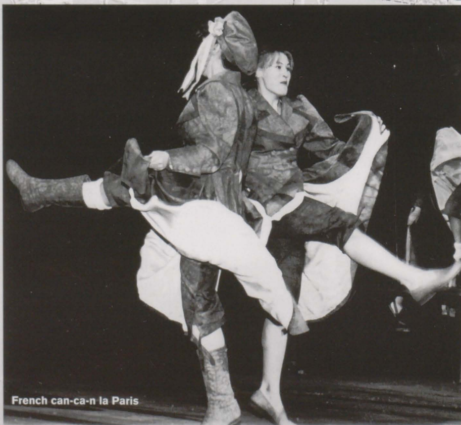
French can-ca-n la Paris

Pentru a fi în ton și semi-ton, nu putem spune decât ca la vechii celți , Beatha agus Sláinte Cyfarchion y Tymor , adică Felices Fiestas, Meilleurs Voeux, Pozdravliaio, Season's Greetings! Ca pe cartonul pe care se sprijinea "bătrânul" Panait Istrati, la Nisa, în fața valurilor de cretă și a Domurilor lucitoare ale corăbiilor capitonate și cu portar la intrarea prin ușa batantă.