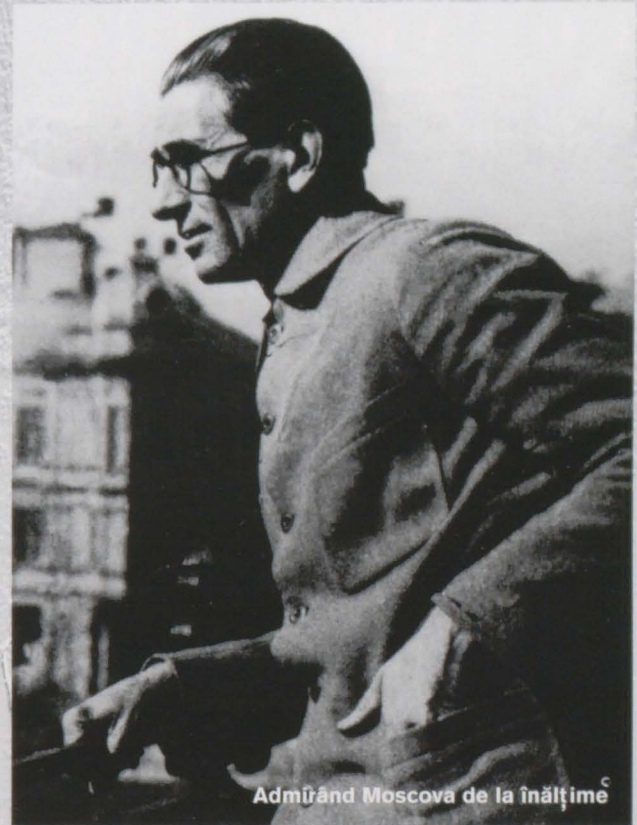
Admîrînd Moscova de la înălțime

"Idealul ameliorării sociale nu va fi cu puțință decât atunci când militanții lui vor fi prieteni, deoarece azi nu sunt așa ceva decât în articole de ziare și de ochii lumii."