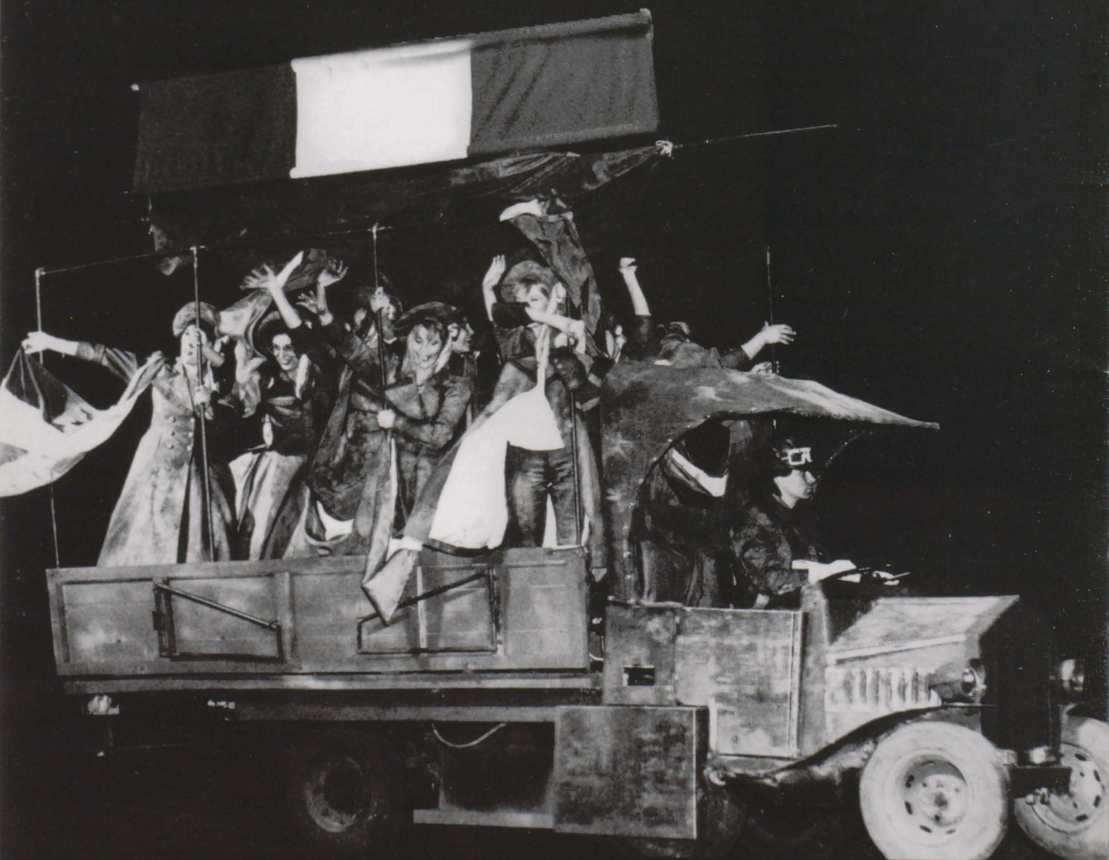
Camionul revoluției la Paris