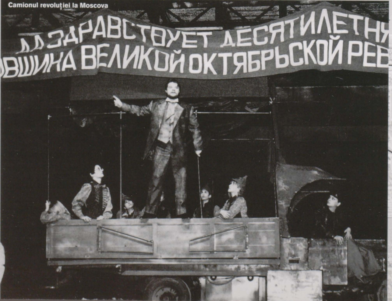
Camionul revoluției la Moscova