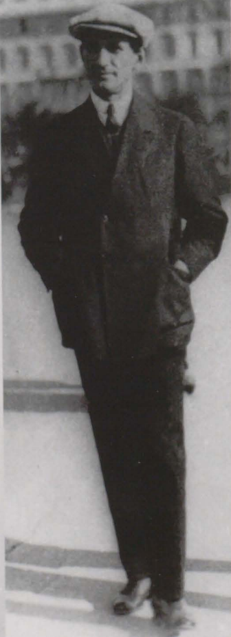
Un hoinar neobosit

ca intensitate cu cea precedentă și cu cea ulterioară, fiecare peripeție nu este altceva decât un