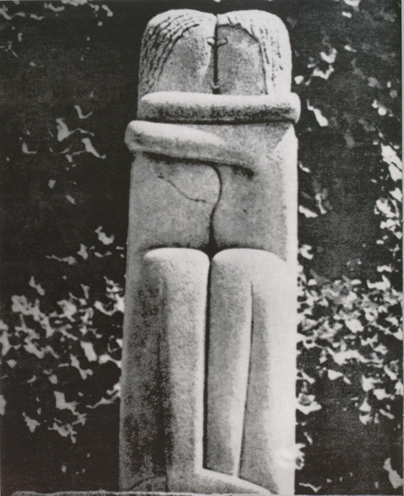
Constantin Brâncuși - SĂRUTUL