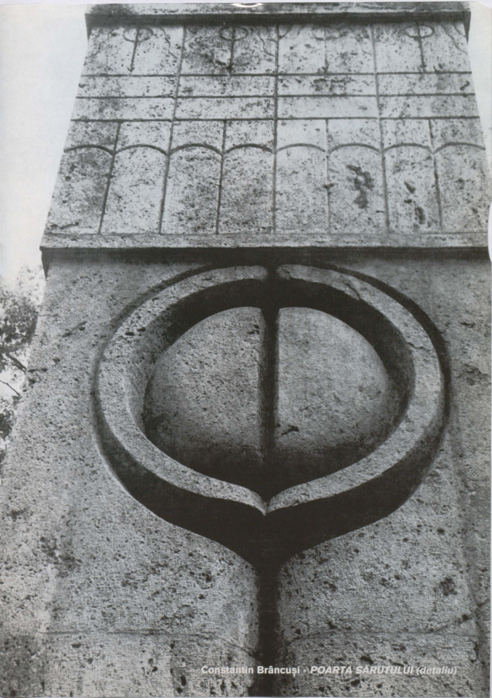
Constantin Brâncuși · POARTA SĂRUTULUI (detaliu)