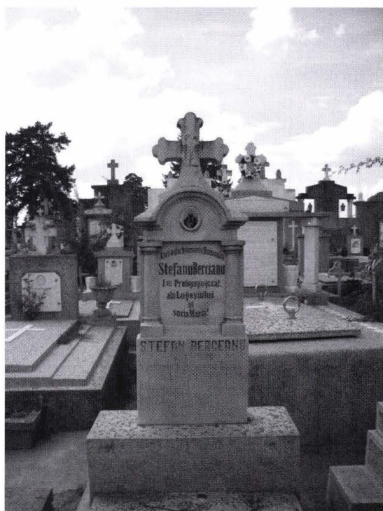
Fig. 2. Mormântul lui Ștefan Berceanu în cimitirul greco catolic din Lugoj.