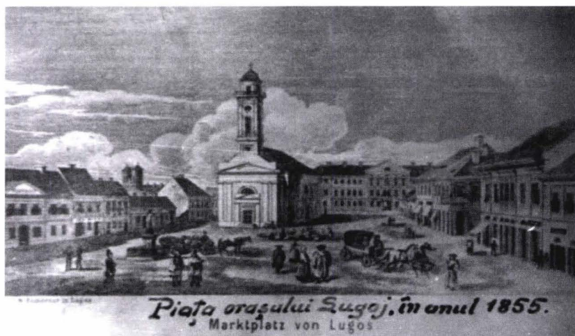
Fig. 4. Catedrala greco catolică din Lugoj din anul 1855. Imagine de epocă.