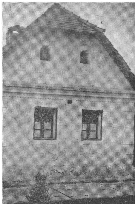
Fig. 4. Ornamentarea fațadei unei case grănicerești în care predomină linia vieții reprezentată printr-o floare de ghiveci (Oțelu-Roșu)-