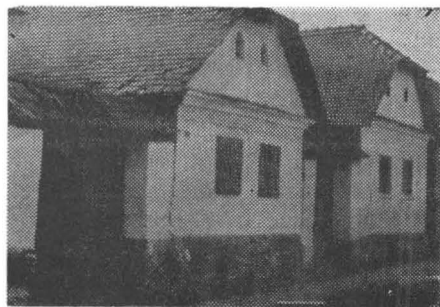
Fig. 6. Case de tip grăniceresc cu acoperișul teșit în față din comuna Obreja, județul Caraș-Severin.