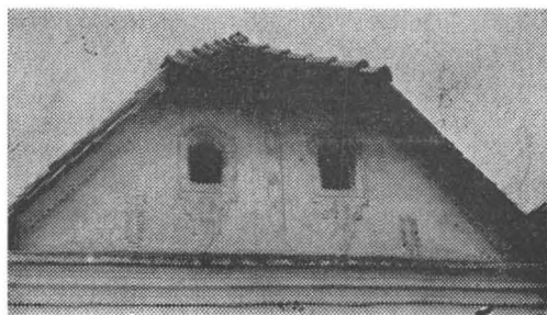
Fig. 5. Detaliu privind combinația armonioasă a ornamentelor geometrice și florale pe fațada unei case grănicerești construită în anul 1833 în comuna Glimboca, județul Caraș-Severin.