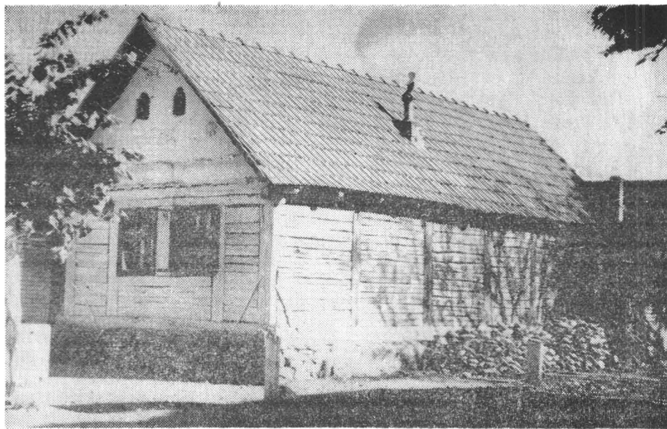
Fig. 1. Casă de tip grăniceresc din lemn, din comuna Obreja, județul Caraș-Severin.

De-a lungul casei, de la stradă și pînă la capătul casei dinapoi, se întindea „tîrnațul“, un fel de coridor deschis ridicat la aceeași înălțime cu casa și despărțit de curte printr-un stăbor de scînduri cu înălțimea de un metru. Intrarea în tîrnaț se făcea prin curte și prin ușa de intrare dinspre stradă. Tîrnațul se găsea sub acoperiș, o prelungire a streșinii, oprind astfel intrarea ploii în casă. Erau însă și case care aveau tîrnațul scurt, așezat numai în fața intrării în tindă.