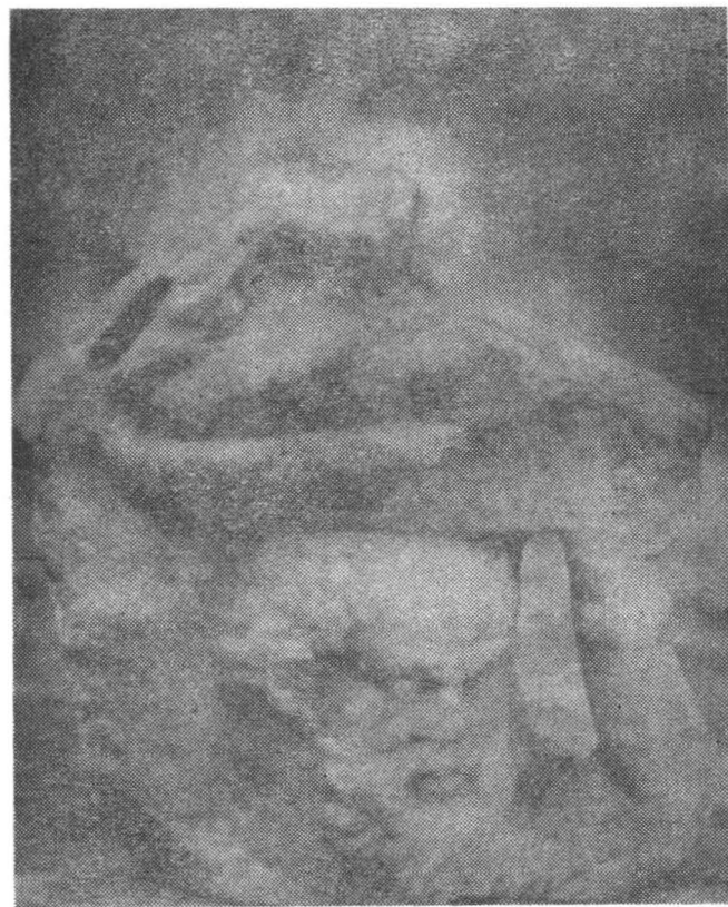
Fig. 5 Fragment sculptural. Abb. 5 Skulpturelles Bruchstück.