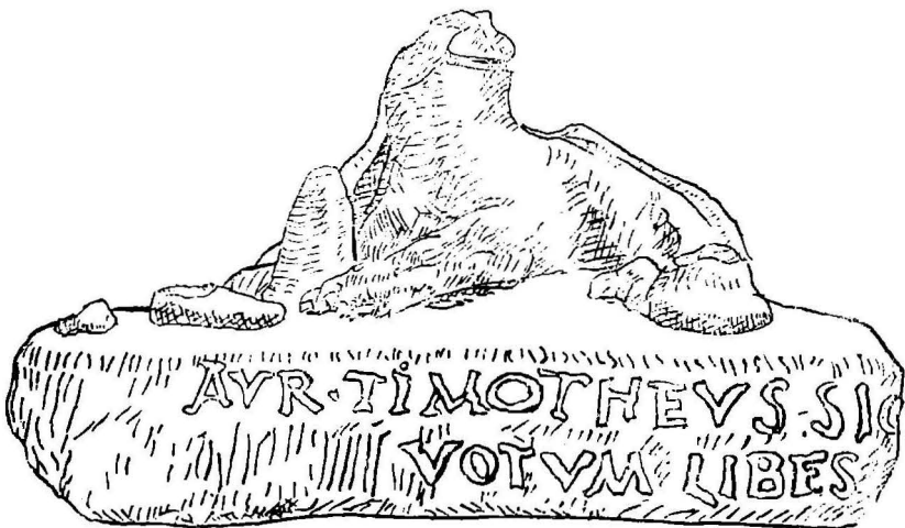
Fig. 11. Relief cu inscripție. Abb. 11. Relief mit Inschrift.