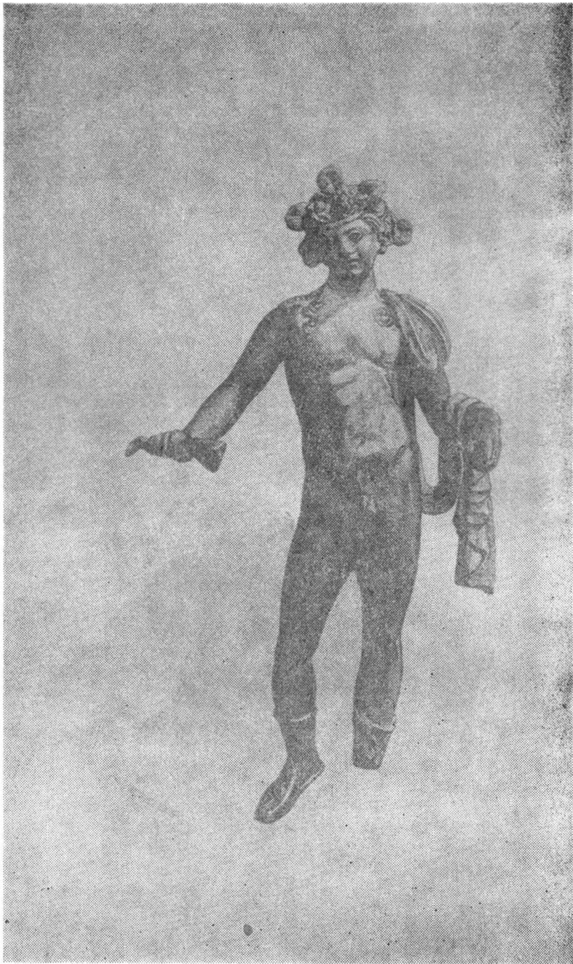
Fig. 1. Statuetă din bronz. Abb. 1. Bronzestatuette.