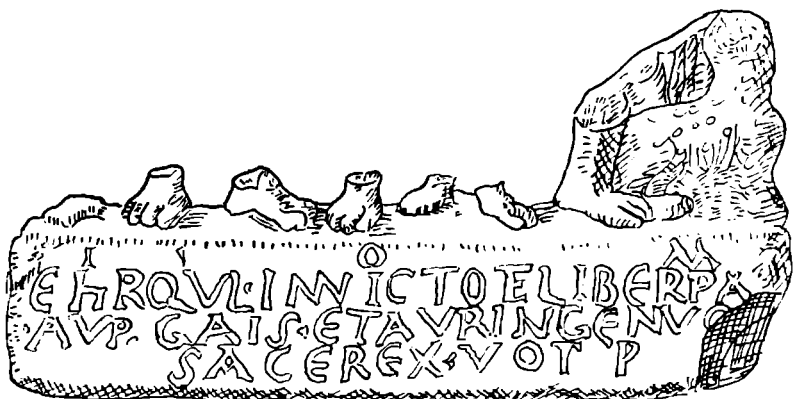
Fig. 12. Fragment sculptural cu inscripție. Abb. 12. Skulpturelles Bruchstück mit Inschrift.

puri: tipul A, în care am inclus reprezentări ale lui Liber însoțit de Ampelos, șarpe și alți acoliți, și tipul B, în care Liber apare alături de Libera, panteră și acoliți.