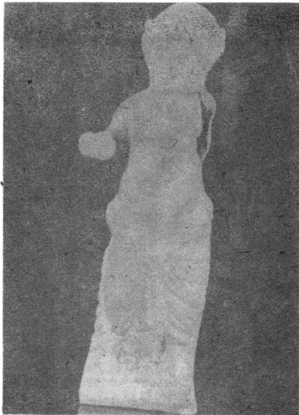
Fig. 7. Statuetă — Silen. Abb. 7. Silenstatuette.