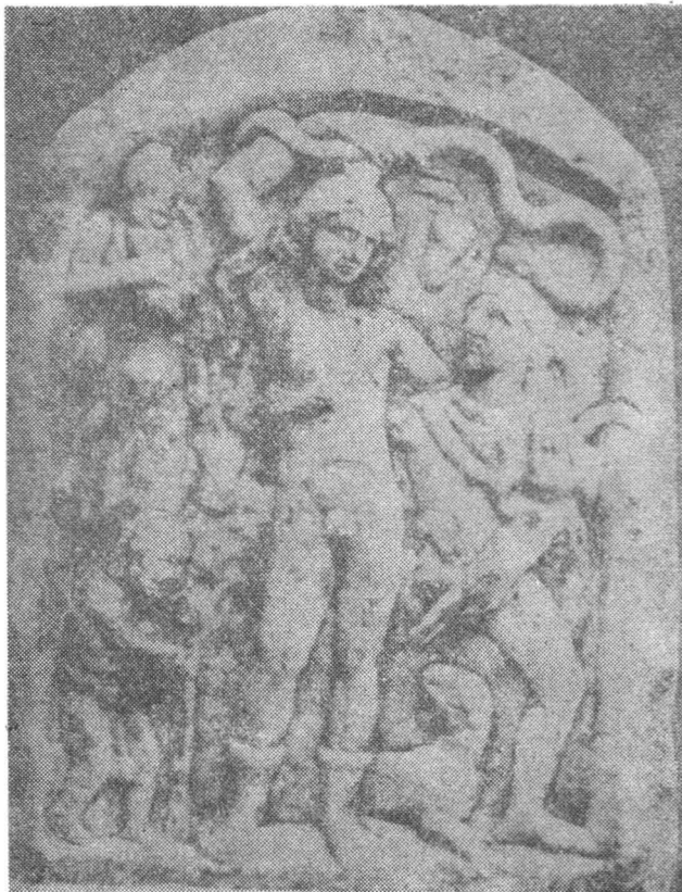
Fig. 3. Placă votivă. Abb. 3. Votivtafel.

barbă, ținând în mâini un syrinx 39 . Cîmpul reliefului e ornamentat cu un vrej de viță de vie de care atîrnă un ciorchine.