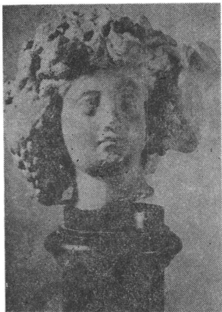
Fig. 8. Capul lui Liber. Abb. 8. Kopf des Liber.