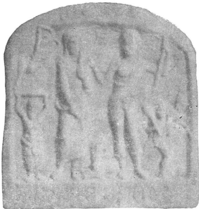
Fig. 4. Tăbliță votivă cu inscripție. Abb. 4. Votivtafel mit Inschrift.