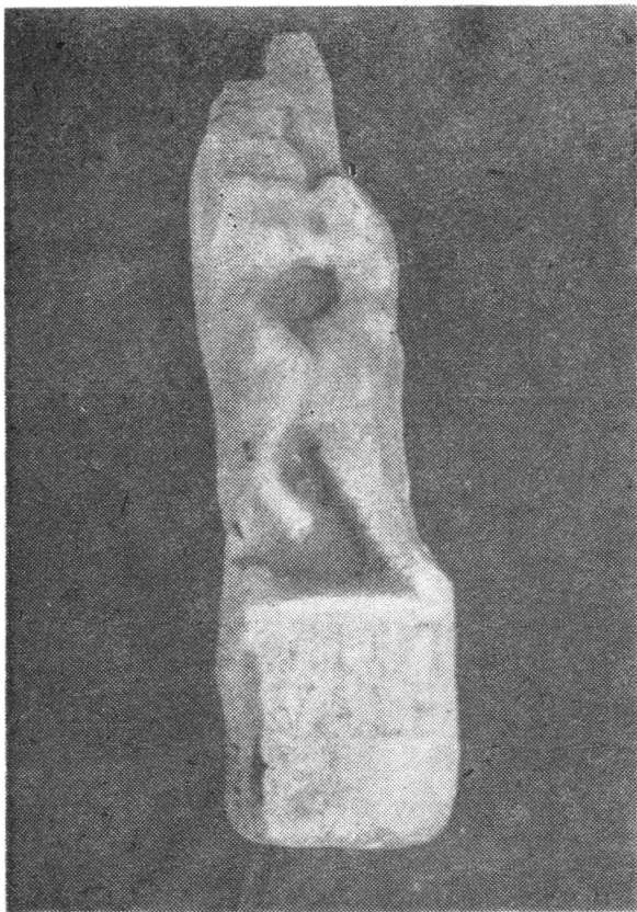
Fig. 6. Relief cu inscripției. Abb. 6. Relief mit Inschrift.