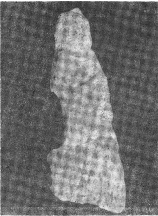
Fig. 10. Menadă. Abb. 10. Menade.