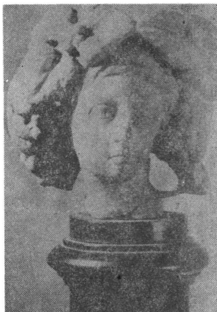
Fig. 9. Capul Liberei. Abb. 9. Kopf einer Statue.

trat doar capul unei bacante care poartă o diademă 53 , iar dintr-un alt grup statuar dionysiac azi dispărut s-a mai păstrat doar o menadă 54 (Fig. 10), înveșmîntată cu o palla cu mîneci scurte, ținînd în mîini o cista mystica . Piesa are analogii cu menada din grupul dionysiac de la Walbrook 55 , Alba Iulia 56 și Hissar 57 .