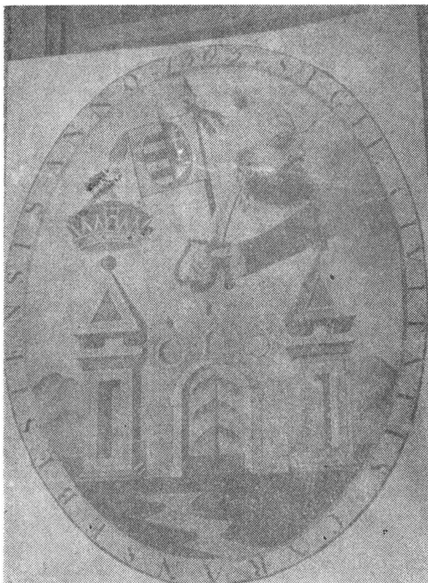
Fig. 4. Sigiliul orașului Caransebeș din anul 1503. Le cachet de la ville de Caransebeș 1503.

Muntele Mic. Această fortificație era adăugată la bastionul Imperial deoarece acesta era expus mai întâi invaziei otomane.