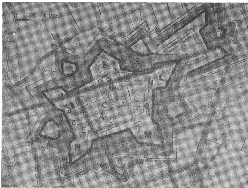
Fig. 2. Planul cetății Caransebeşului suprapus pe planul actual al oraşului. Le plan du fort de Caransebeş superposé avec le plan actuel de la ville.