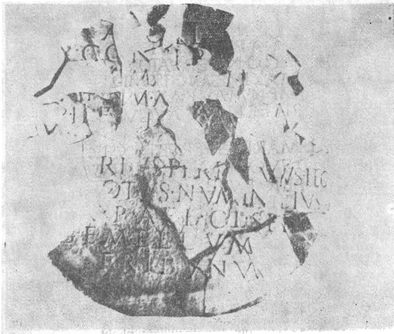
Fig. 2. Inscriptie romană în faza de lucru. Fig. 2. Roman Inscription in work stage (phase).