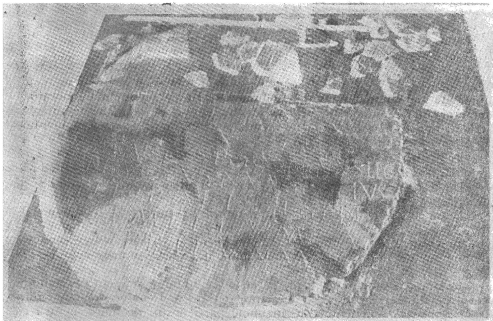
Fig. 3. Inscriptie romană în faza de lucru. Fig. 3. Roman Inscription in work stage (phase).