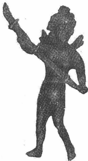
Fig. 2. Statuetă romană „genius loci”, descoperită într-un context de sec. VIII-IX (Gornea – Zomoniță)