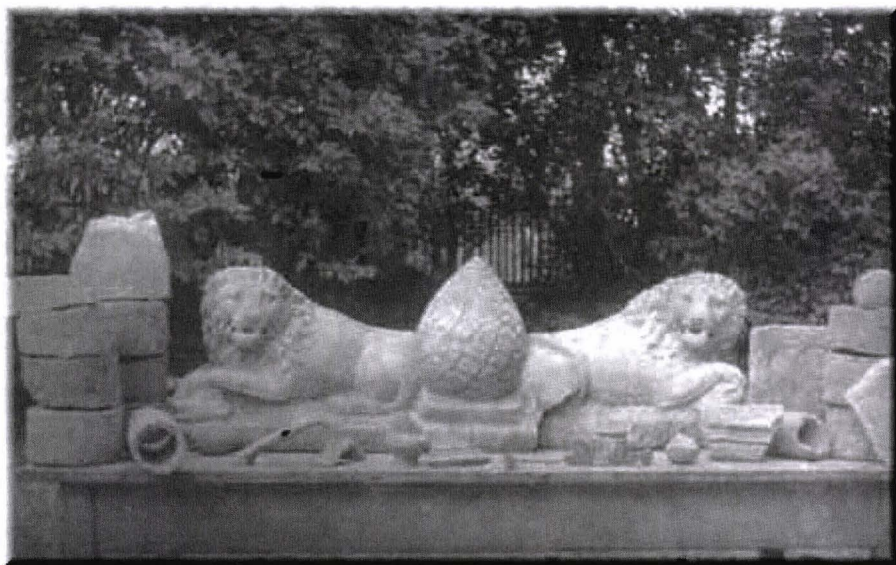
Fig. 2. Tibiscum. Lei funerari descoperiți de Vasile Pârvan în anul 1920 și aflați în colecția Institutului de Arheologie „Vasile Pârvan” din București

Aflat în vara anului 1920 la tratament la Băile Herculane (Mehadia) 21 , Vasile Pârvan face o vizită la Tibiscum , unde este invitat de către Dimitrie Cioloca 22 și Adam Cucu 23 , vede și cercează vestigiile arheologice păstrate și chiar descoperă în fața unei porți doi lei funerari folosiți ca și bancă.