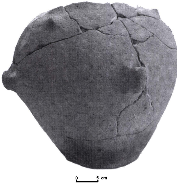
Fig. 1. Caransebeș – Balta Sărată. Vas neolitic.

bitronconică, a fost lucrat dintr-o pastă omogenă, semifină, ca degresant folosindu-se nisip cu mică și cuarț. De culoare brun-deschis (spre gălbui-închis), atât suprafața, cât și interiorul vasului au fost bine netezite, iar arderea s-a desfășurat în condiții oxidante, fapt dovedit de culoarea omogenă roșie-portocalie a pasteii, datorată prezenței hematitului 25 . Ca elemente decorative au fost folosite caneluri verticale (tip C4) și butoni conici extrași din pereții vasului. De asemenea, pe maxima circumferință, au fost modelate patru toarte prevăzute cu perforații verticale, iar atât acestea cât și, cei patru butoni cu dispunerea lor simetrică pe partea superioară, dau impresia unui zigzag. Cum partea superioară (buza) lipsește, nu se poate preciza forma gâtului deși, astfel de amfore înalte, în unele cazuri sunt prevăzute cu gât îngust, tocmai pentru vasele capac 26 .