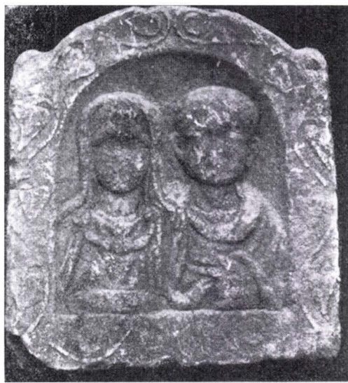
Fig. 3. Il monumento funerario di Pejĕ-Peć