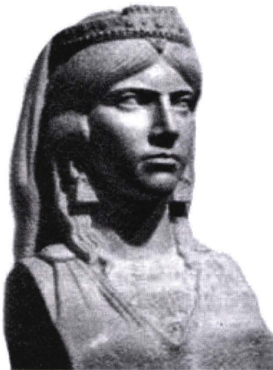
Fig. 1. Regina illyricha Teuta, moglie del re Agron

Un tale comportamento fu presente anche nelle tribù del Iliricum occidentale, dove furono venerate le dee Thana e Diana, addirittura nella parte sud-ovest fu molto importante il culto di Diana parte del tribù kandav (Diana Candaviensis) 60 reliquie dei quali sono ancora preservati anche oggi nei festeggiamenti popolari in Albania in data 14 Marzo 61 . Proprio in queste parti ha vissuto anche la regina (Teuta) o i reggenti dei nuovi re (Triteuta), 62 erede del trono del re Agron.