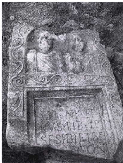
Fig. 2. Il monumento funerario di Pejĕ-Peć

Questi elementi vengono rispecchiati al meglio nelle pietre tombali dove la presentazione figurativa dei defunti occupano un terzo della sagoma umana e sono elaborate in un rilievo di grandezze medie (foto 1 e 2).