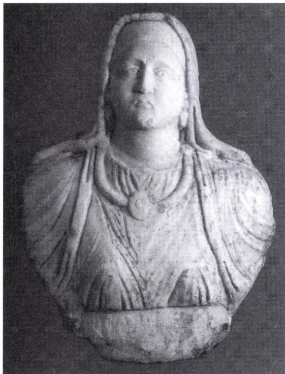
Fig. 4. La “signora dardanica” di Klokot

Si nota altrettanto che non esistono regole in che parte si presenta una figura specifica, per ciò in certi casi la figura femminile si presenta nella parte sinistra ed in altri casi la figura maschile è posizionata in questo lato.