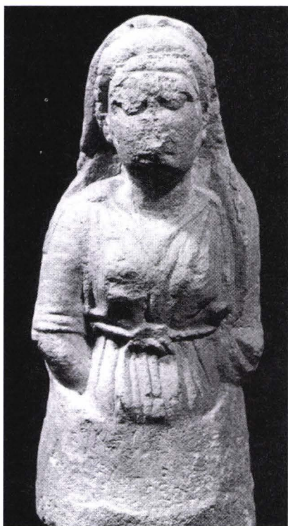
Fig. 5. La statua di donna illyricha trovata a Dimal