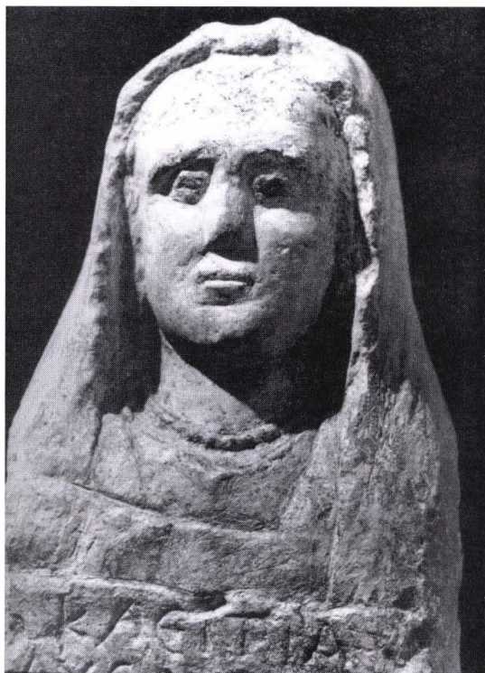
Fig. 6. La statua di donna illyricha trovata a Dyrrahium