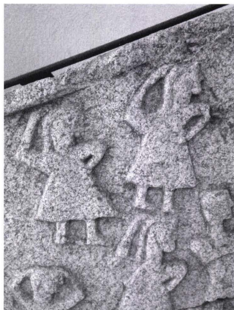
Fig. 9. Le figure delle donne nella piastra trovata a Kamenica e Kosovës

Un caso di un monumento dedicato da una donna è stato scoperto in Mitrovica – Kosovo (foto 7). 95