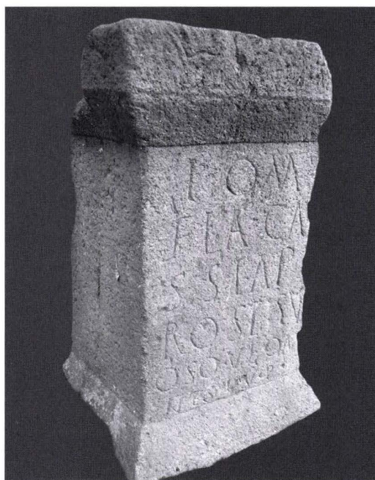
Fig. 10. Altare di Mitrovica e Kosovës

Un caso di un monumento dedicato da una donna è stato scoperto in Mitrovica – Kosovo (foto 7). 95