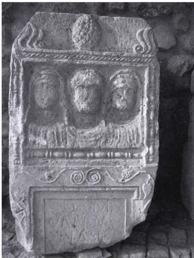
Fig. 7. Parte superiore di un monumento funerario trovato a Pejë-Pec

Le figure femminili sono presentati vestite in due camicie, mentre il capo e' coperto dal foulard caratteristico, la quale cade sulle spalle coprendo in tal modo anche la parte superiore del corpo 70 . Questi foulard sono rinvenuti nelle presentazioni figurativi delle donne nella maggior parte dei territori abitati dalla popolazione dardana rispettivamente nella regione di Peja odierna, Prishtina, Prizren, Gjakova e Gjilan (foto 3), (la signora dardanica di Klokot) questo si puo' considerare una caratteristica dardanica 71 anche se e' presente nelle rivelazioni figurativi delle altre aree abitate dagli iliri (foto 4 e 5, statue delle donne di Dimal e Dyrrah). In certi territori illirici, specialmente nel tribu' japoda le donne decoravano la testa con diadema di bronzo o di altri metalli, e diverse collane. 72