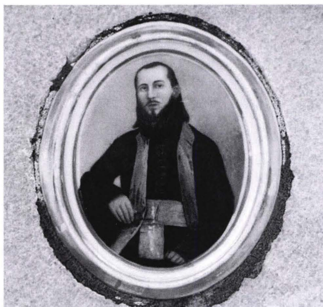
Fig. 3. Portretul lui Ștefan Berceanu (1802–1870)