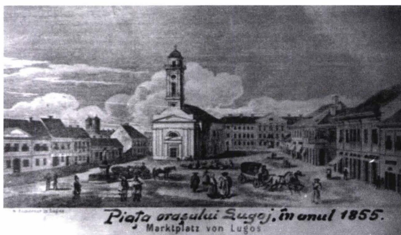
Fig. 4. Catedrala greco catolică din Lugoj din anul 1855. Imagine de epocă.