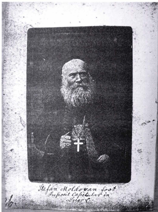
Fig. 1. Portretul lui Ștefan Moldovan (1813–1900).