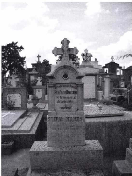
Fig. 2. Mormântul lui Ștefan Berceanu în cimitirul greco catolic din Lugoj.