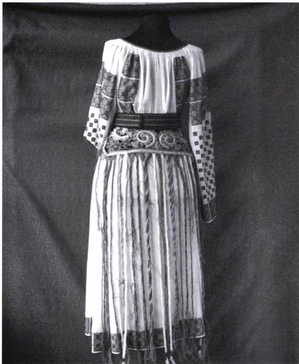
Fig. 4 – Opreg (M.C. Nr. inv. 5139) zona etnografică Valea Timișului ornament decorativ principal coarnele berbecului.