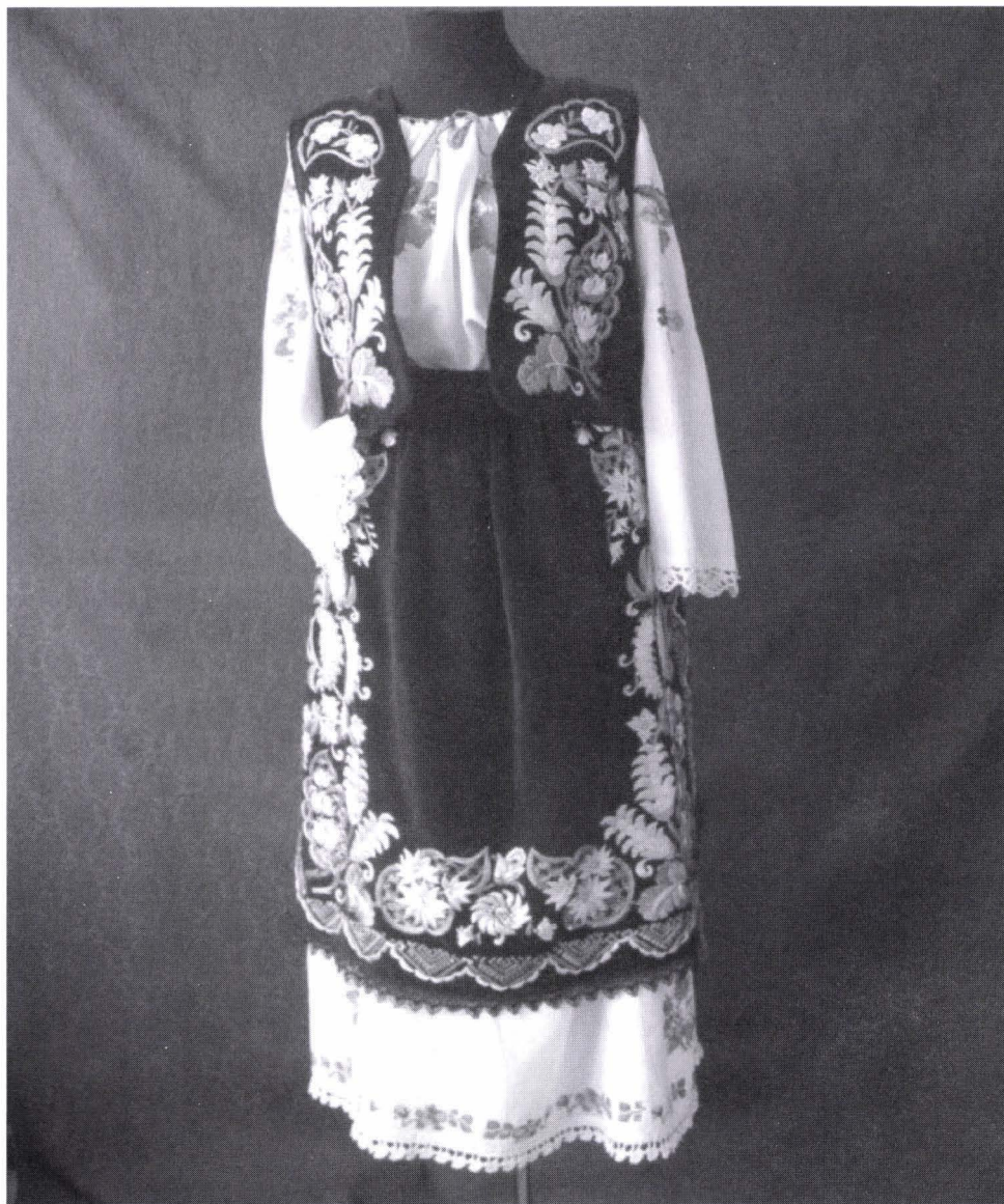
Fig. 1 – Costum popular femeiesc zona etnografică Valea Timișului, catrință (M.C. Nr. inv. 43816) și laibăr din catifea, (M.C. Nr. inv.43818) motive ornamentale, linia ondulată, meandru format din semicercuri în interiorul cărora se afla ornamentul zale, ornamente fitoforme, spic de garâu, flori și frunze mari. Ciupagul (M.C. Nr. inv 43814) și poalele (M.C. Nr. inv. 43815) sunt ornamentate cu motive florale în buchet și ghirlande.