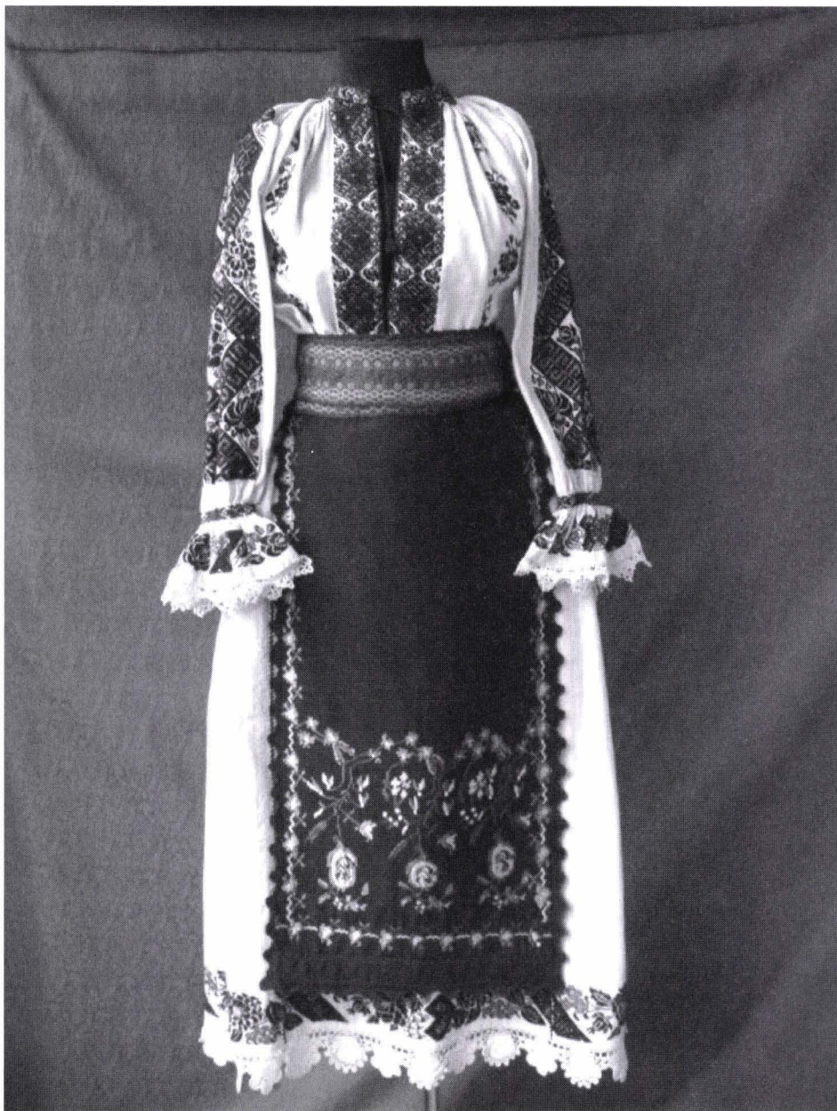
Fig. 3 – Costum popular femeiesc zona etnografică Valea Almăjului, compus din ciupag (M.C. Nr. inv. 17456), poale (M.C. Nr. inv.17453), cătrînță (M.C. Nr. Inv. 6758), brâu (M.C. Nr. Inv. 3660) ornamente florale, decor geometric, pătrate, romburi, linii în zig-zag, crucea dreaptă.