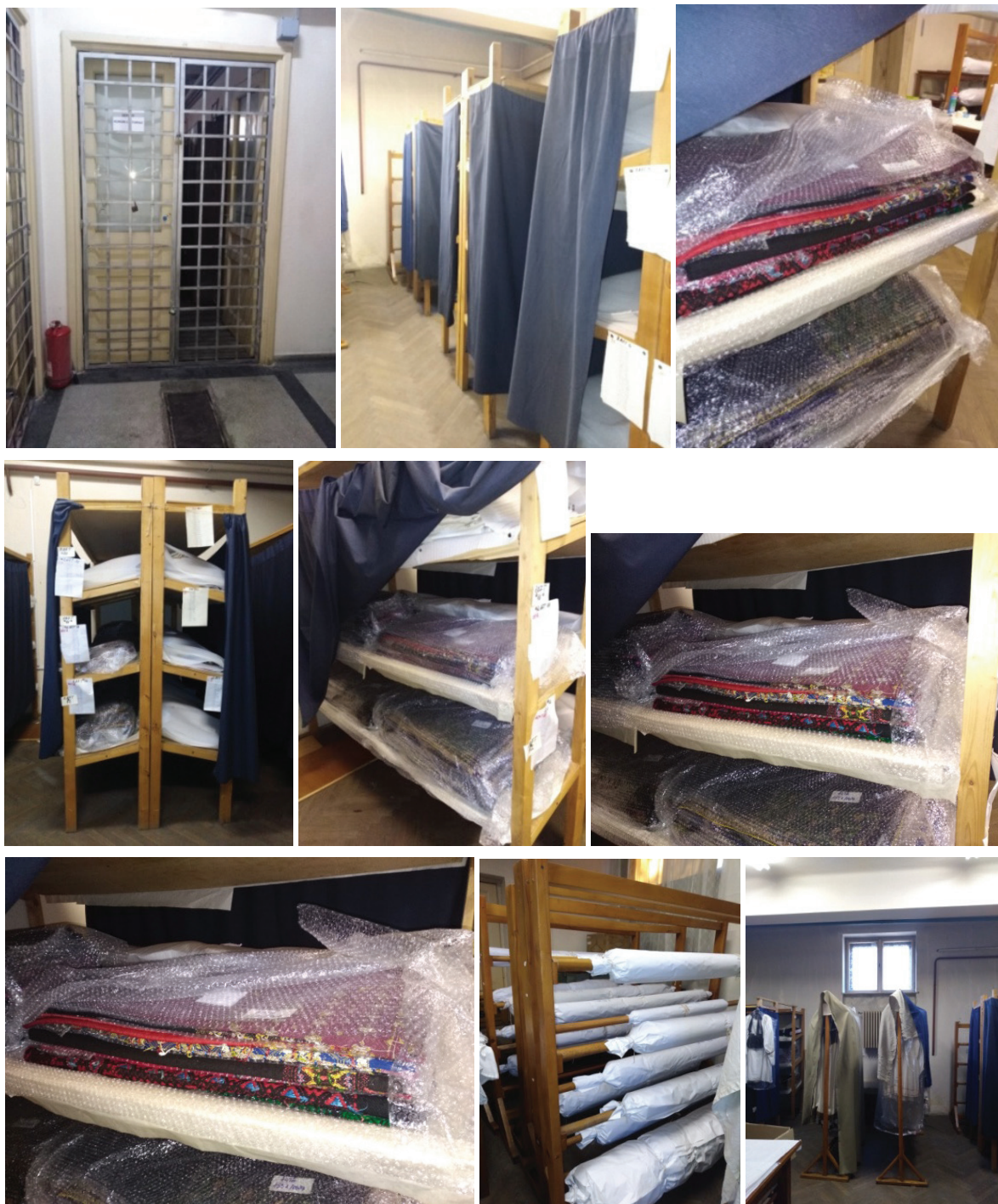
Aspecte din depozit textile

A fost montat și un sistem de securitate respectiv camere video. În depozit este instalat un termohigrometru digital și un dezumidificator, care este descărcat periodic, măsură necesară datorată prezenței umidității ascensionale.