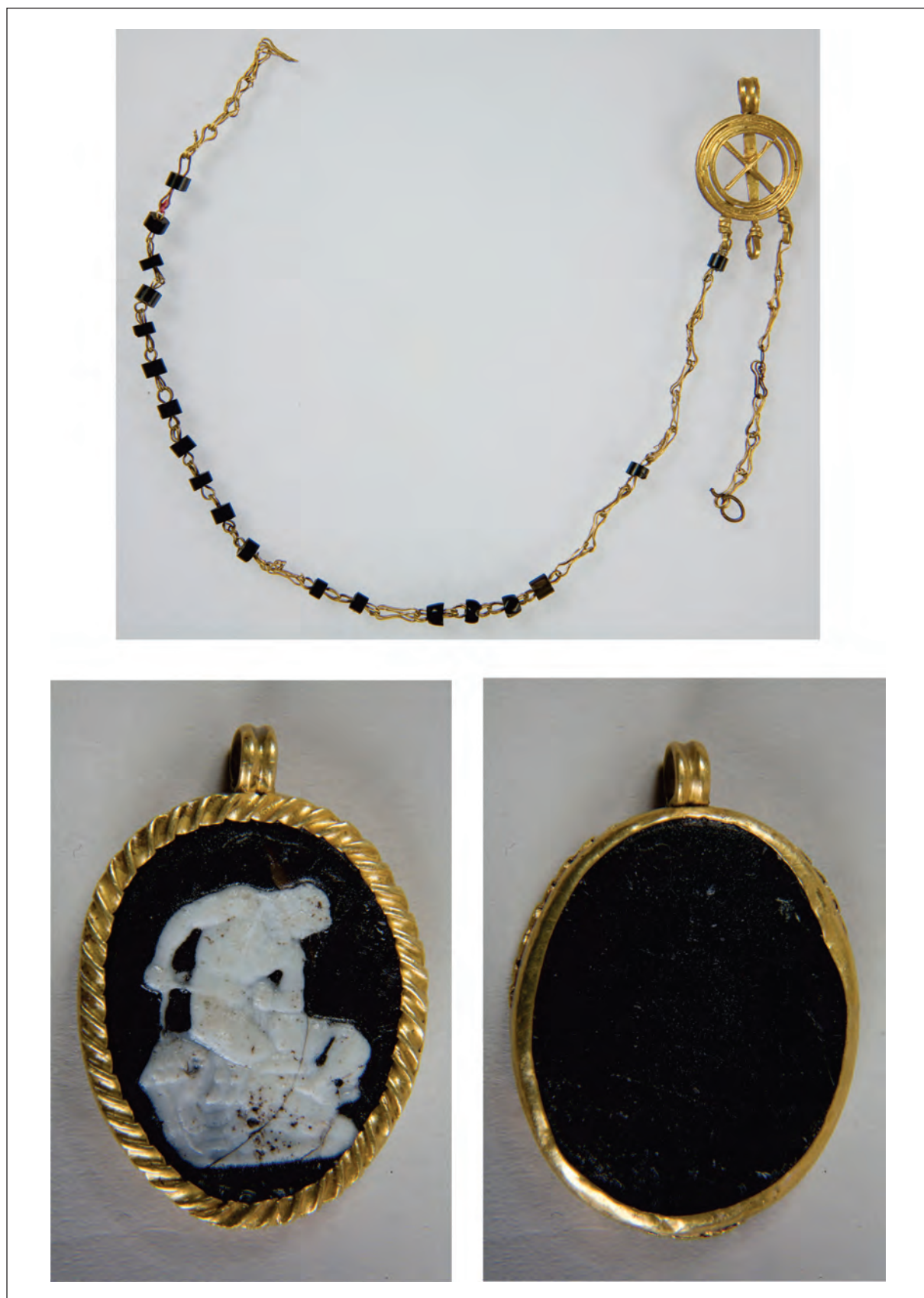
Pl. III. Colierul cu pandantiv descoperit la Drobeta, colecția Muzeului Național de Istorie a României, nr. inv. C 491/1-3); The necklace with pendant discovered in Drobeta, the collection of the National Museum of History of Romania, no. inv. C 491 / 1-3).