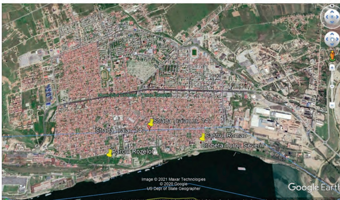
Pl. I. Orașul modern Drobeta Turnu- Severin, cu locațiile asociate discuțiilor, apud Google Earth, accesat la 25. 01. 2021; Modern city Drobeta Turnu- Severin with the locations associated with discussions, after Google Earth, accessed in 25. 01. 2021