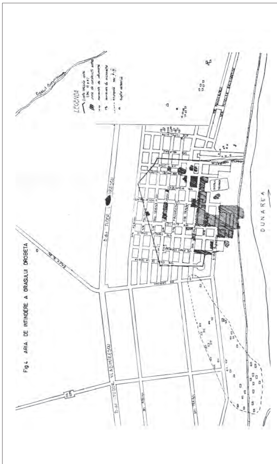
Pl. II. Orașul modern care suprapune ruinele romane de la Drobeta și cu locația Str. Traian, nr. 147, apud Benea 1977, fig. 4; The modern city that overlaps the Roman ruins from Drobeta and the location of Traian street, no. 147, after Benea 1977, fig. 4.