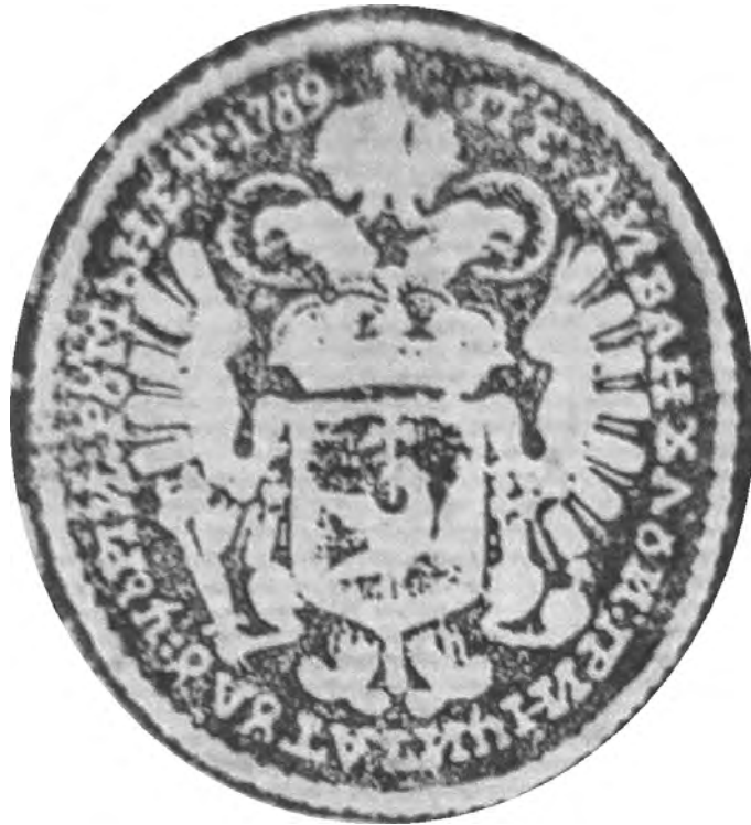
Fig. 3. Sigiliul Divanului Principatului Țării Românești (1789).