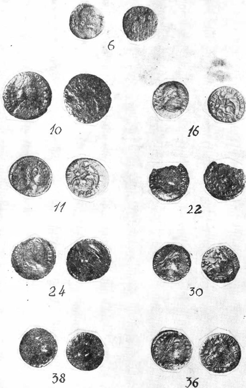
M. Moga—N. Gudea, Un tezaur din secolul al IV-lea la Dalboșeț.