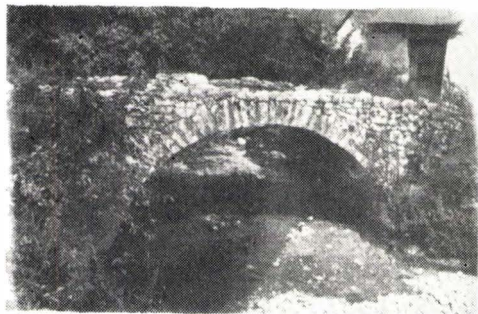
Pod de piatră peste pîriul Valea Mare la Ilidia. jud. Caraș-Severin.

Azi încă, aproximativ 90% din construcțiile gospodăriilor din sat — mai vechi sau mai noi — sînt ridicate din piatră. Numeroase poduri, zidite din blocuri masive de piatră arcuite maiestuos peste pîraie repezi de munte, vorbesc de o uimitoare și veche dexteritate a locuitorilor în mînuirea pietrei. De altfel pentru întreaga zonă submontană din jurul Oraviței, bogată în calcare și gresii, piatra a reprezentat și