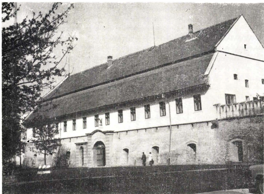
Bastionul Cetății — Expoziția de artă populară bănățeană. Sediul Secției Etnografie.