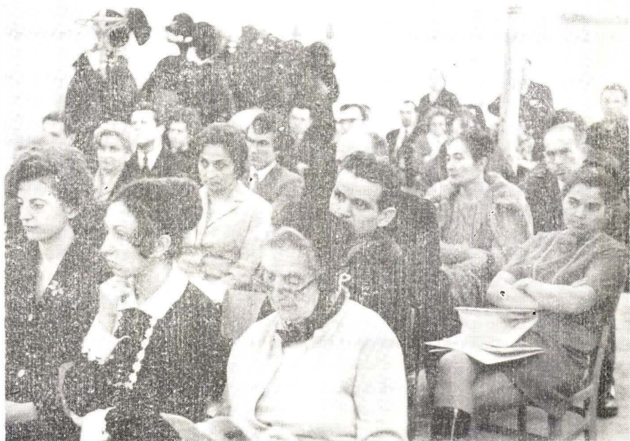
Participanți la Sesiunea jubiliară din ianuarie 1973.