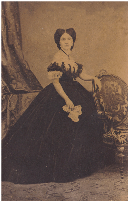
Fig. 3 C.P. Szathmári, Doamna Elena Cuza, portret cu rochie crinolină, circa 1863.