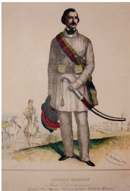
Fig. 1 Generalul Gheorghe Magheru, litografie color. (Colecția Tipărituri și imprimate, M.M.B.).