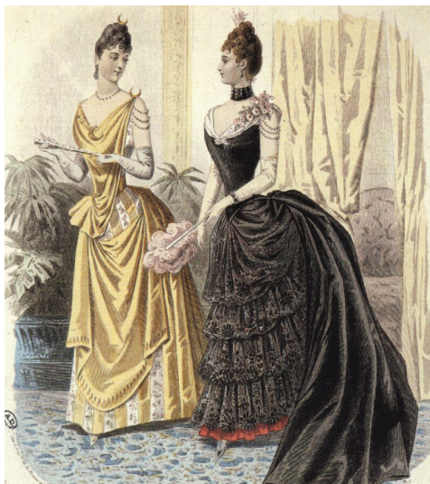
Fig. 5. Mode Illustrée, Paris, 1888. Tipăritură din album.