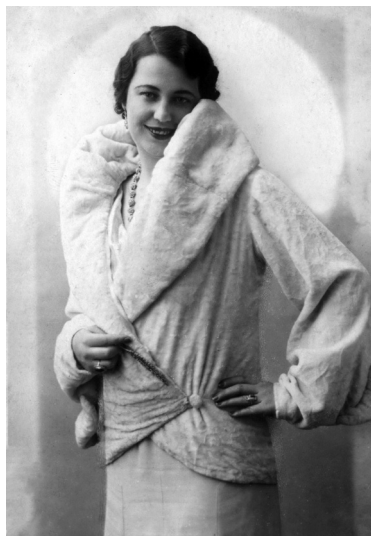
Fig. 6 Portret femeie cu rochie anii '20. (Colecția Fotografii, cărți poștale, clișee fotografice, M.M.B.).