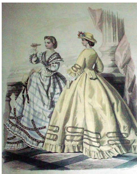
Fig. 2 Rochii cu crinolină, E. Preval, Mode Illustrée, filă din album, Paris, 1869. (Colecția Tipărituri și Imprimate, M.M.B.).