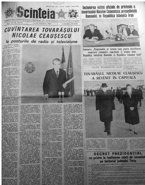
Fig. 4 Scinteia din 21 decembrie 1989.