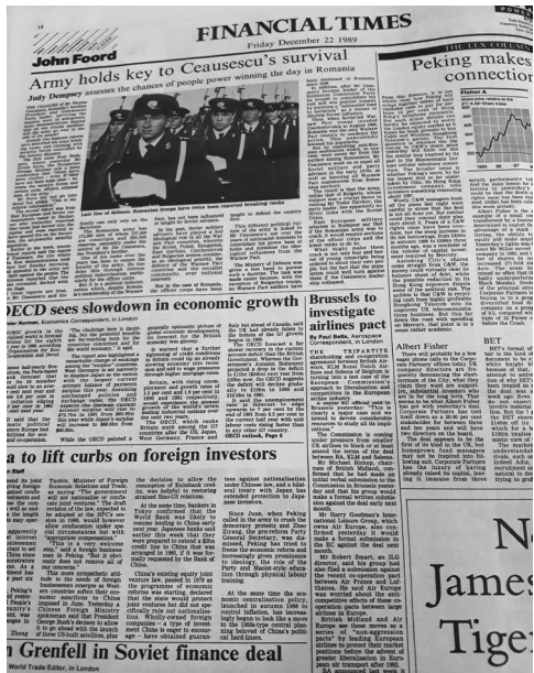
Fig. 5 Financial Times din 22 decembrie 1989.