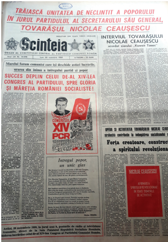
Fig. 1 Scînteia din 20 noiembrie 1989.