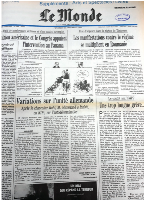
Fig. 8. Le Monde din 22 decembre 1989.