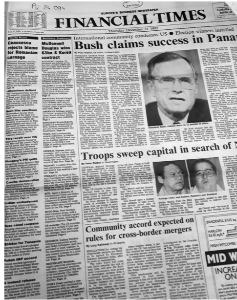
Fig. 3 Financial Times din 21 decembrie 1989.