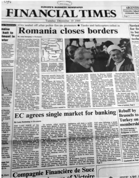
Fig. 2 Financial Times din 19 decembrie 1989.