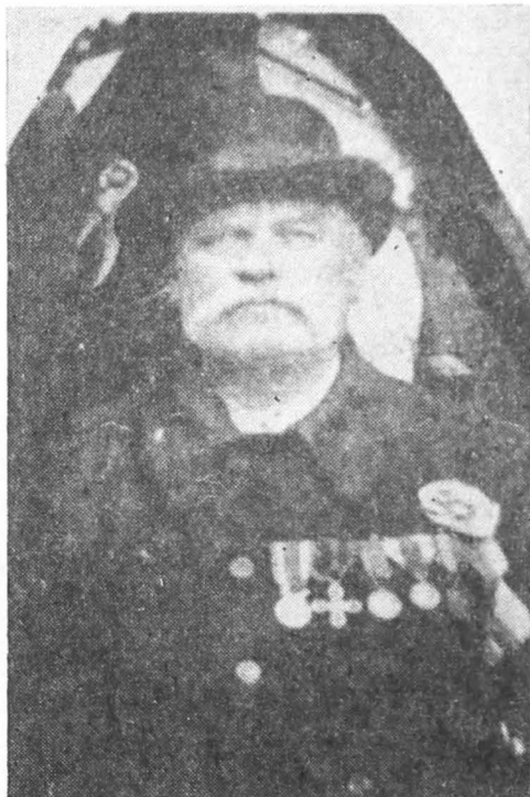
Fig. 5. Erou din Pietroșița.