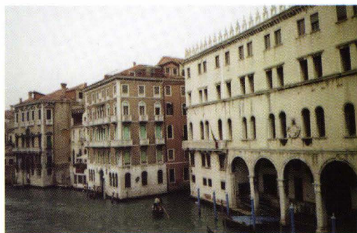
Fig. 1. a, b, c, d. Palate venețiene cu fațadele spre Canal Grande. Zona Rialto