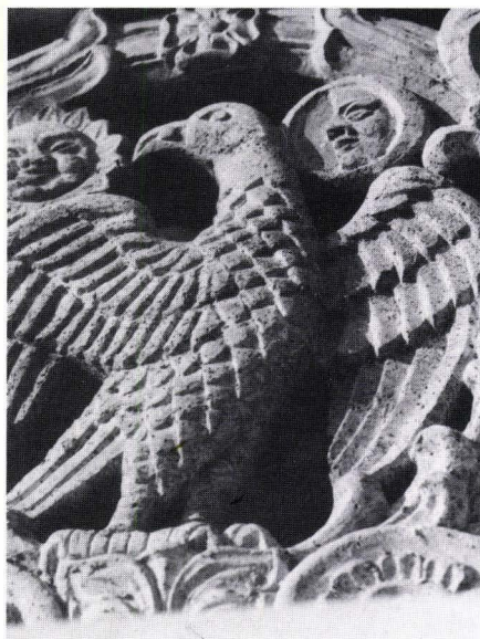
Fig. 6. Palatul din Potlogi. Acvila valachica. Stema oficiala de tip heraldic a Țării Românești. Detaliu din panoul balustradei foișorului