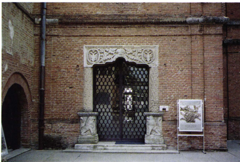
Fig. 4. Palatul brâncovenesc din Mogoșoaia. Ancadramentul ușii de intrare.