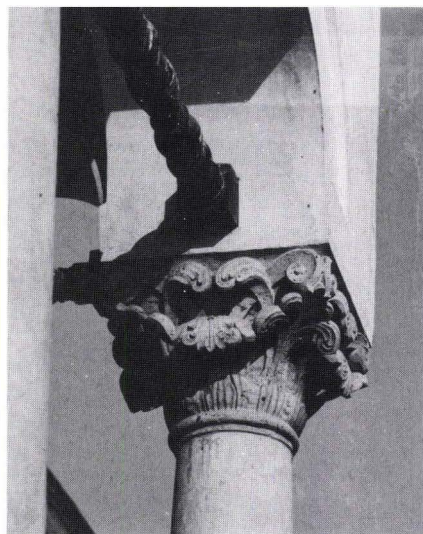
Fig. 4. Palatul din Potlogi. Coloana de la foisor