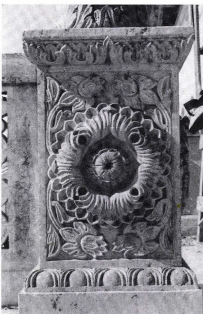
Fig. 5. Palatul din Potlogi. Baza de coloana de la foisor.