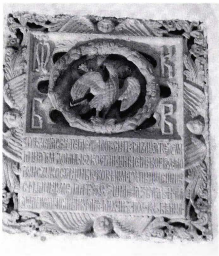
Fig. 3. Palatul din Potlogi. Pisania.