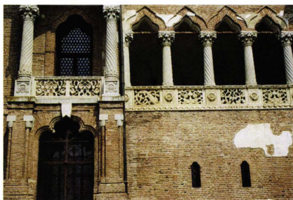
Fig. 5. a, b, c. Palatul din Mogoșoaia. Fațada de vest. Detalii.