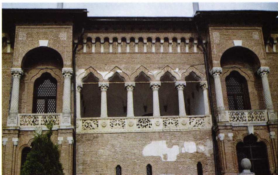
Fig. 2. Palatul brâncovenesc din Potlogi. Dubla loggie de pe fațada de nord.