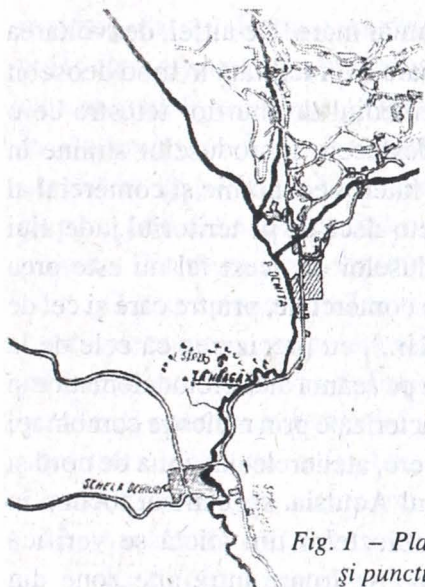
Fig. 1 – Planul comunei Ocnița și punctul „La Hoagă”.