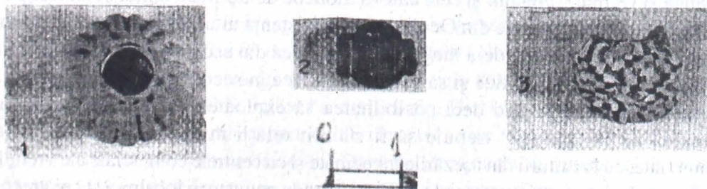
Fig. 4 – Mărgelile din așezarea de la Ocnița.