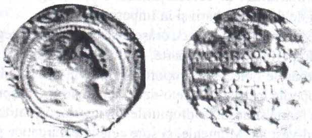
Fig. 3 – Tetradrachmă macedoneană de tip Alexandru cel Mare.