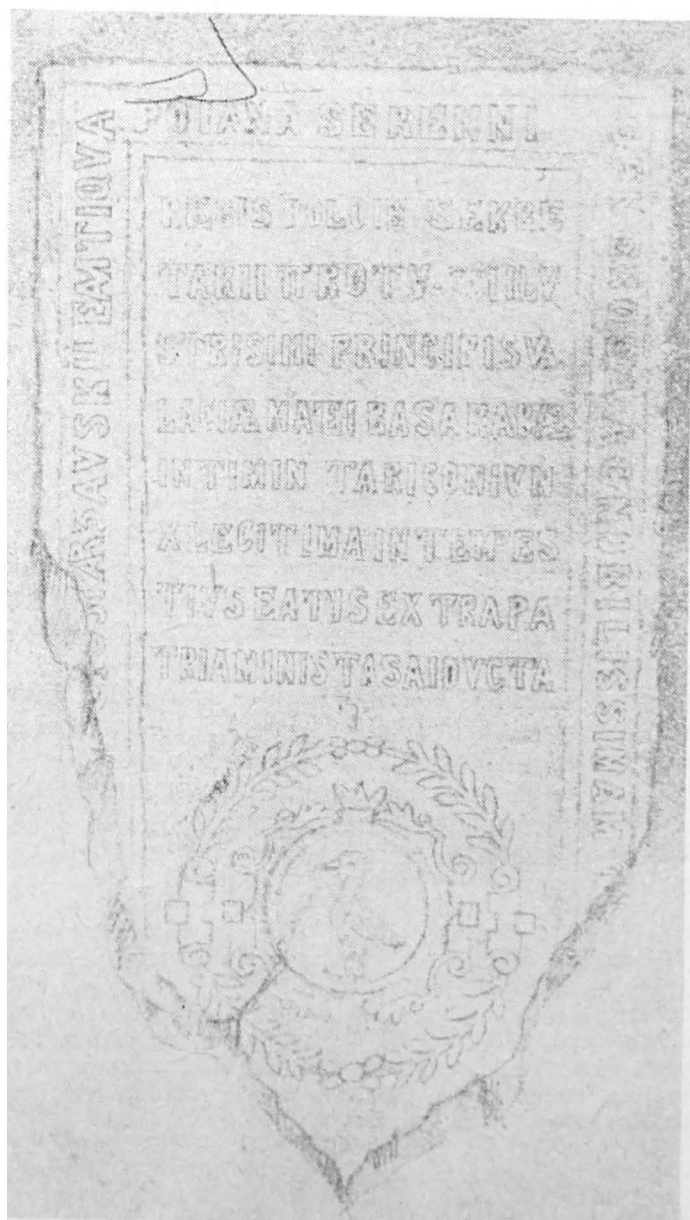
Fig. 2 — 14 m. — Fragment de piatră de mormint a Sofiei Starzawska, aflată la sfârșitul secolului trecut la biserica catolică Sf. Maria (Desen de Carol Isler, pe la 1870)