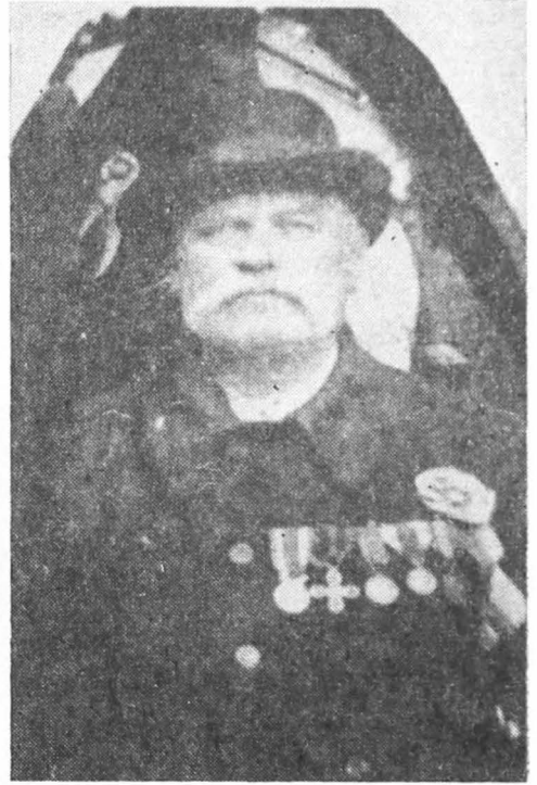
Fig. 5. Erou din Pietroșița.