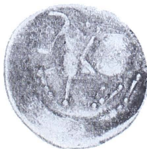
Planșa III. Monede getice de tip Vîrteju—București din tezaurul de la Adînca (mărite)