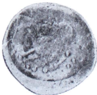
Plaușa IV. Monede getice de tip Virteju—București din tezaurul de la Adinca (mărite)