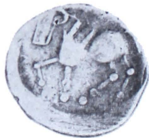
Plaușa VI. Monede getice de tip Virteju—București din tezaurul de la Adinca (mărite)