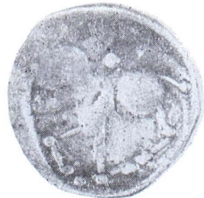
Planșa V. Monede getice de tip Virteju—București din tezaurul de la Adinca (mărite)