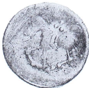
Planșa I. Monede getice de tip Vîrteju—București din tezaurul de la Adinca (mărite)