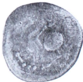
Planșa II. Monede getice de tip Vîrteju—București din tezaurul de la Adîncă (mărite)