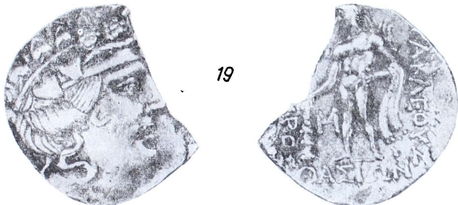
Plansa VII. Tetradrăhmă thasiană, poate din tezaurul de la Adinca.

din trei globule, pare a fi impusă de asemănarea cu monedele de tip Adîncata, considerate ca precedînd tipul Vîrteju-București. 14 Ar urma firese, derivînd organic din această categorie, monedele cu călărețul realizat din două globule. Acesta apare însă și în imaginile, parcă mai fine, de pe monedele din tezaurul de la Leu (jud. Dolj). Dacă un riguros studiu de detaliu, și ne îndreptăm nădejdea tot către anchete de mare amploare, cum a întreprins C. Preda, nu va putea să scoată în evidență deosebiri fundamentale, ne-am putea gândi, pe baza asemănărilor formale ale rv., la o oarecare interferență cronologică între tipul Vîrteju-București și tipul Adîncata 16 În caz de interferență cronologică, s-ar putea avea în vedere explicația unor dezvoltări parțial paralele, cu imagini de avers distincte. Studii viitoare vor elucidă, neîndoios, semnul nostru de întrebare.