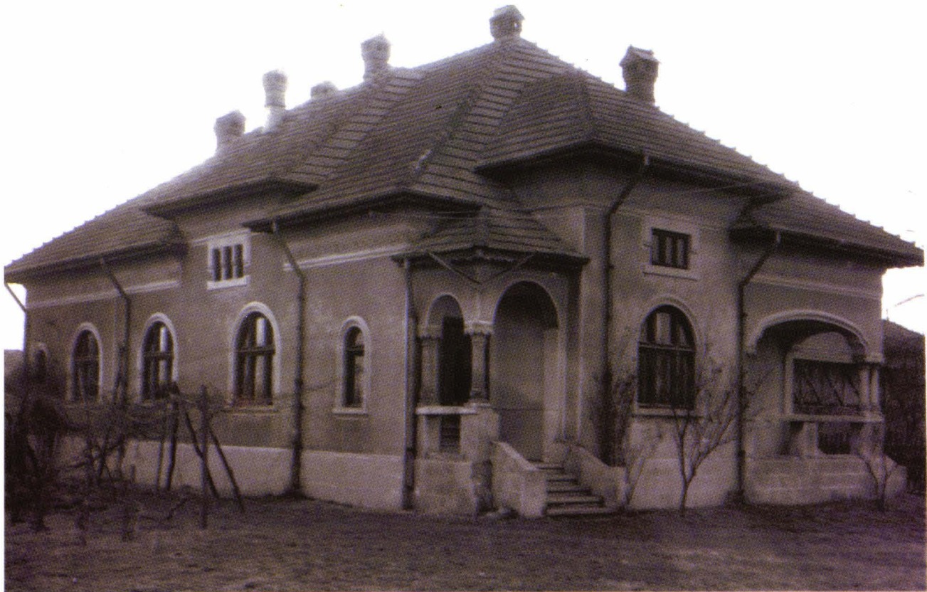
Una din casele „gemene” ale fraților Ionescu