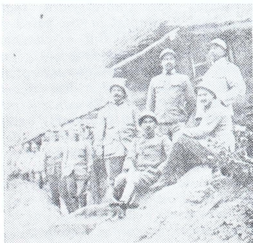
Fotografie de front

Sfârșind seria identificărilor putem afirma de asemenea că sublocotenentul Haranoiu din carte, nu este altul decât sublocotenentul Hari-tiade, așa cum apare în istoricul regimentului. Procedul de modificare a numelui fiind de astă dată înlocuirea unui sufix onomastic grecesc cu unul românesc.