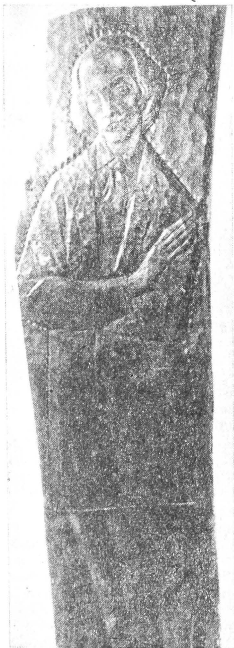
Grigore Alexandrescu, sculptură în lemn de jugastru de Nicolae Kruch, aflată în Muzeul scriitorilor țirgovișteni

Așadar, Muzeul va trebui să pună în valoare rezultatele importanțelor investigații făcute în acest domeniu.