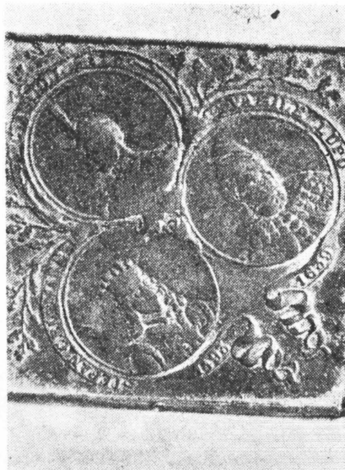
Fig. 3-4. Medalie dobândită de olarul Nicolae Gh. Ștefan pe câmpul de luptă.