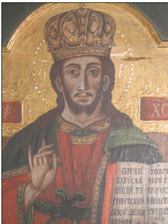
Iisus Hristos învățător, icoană împărătească pe iconostas – dreapta