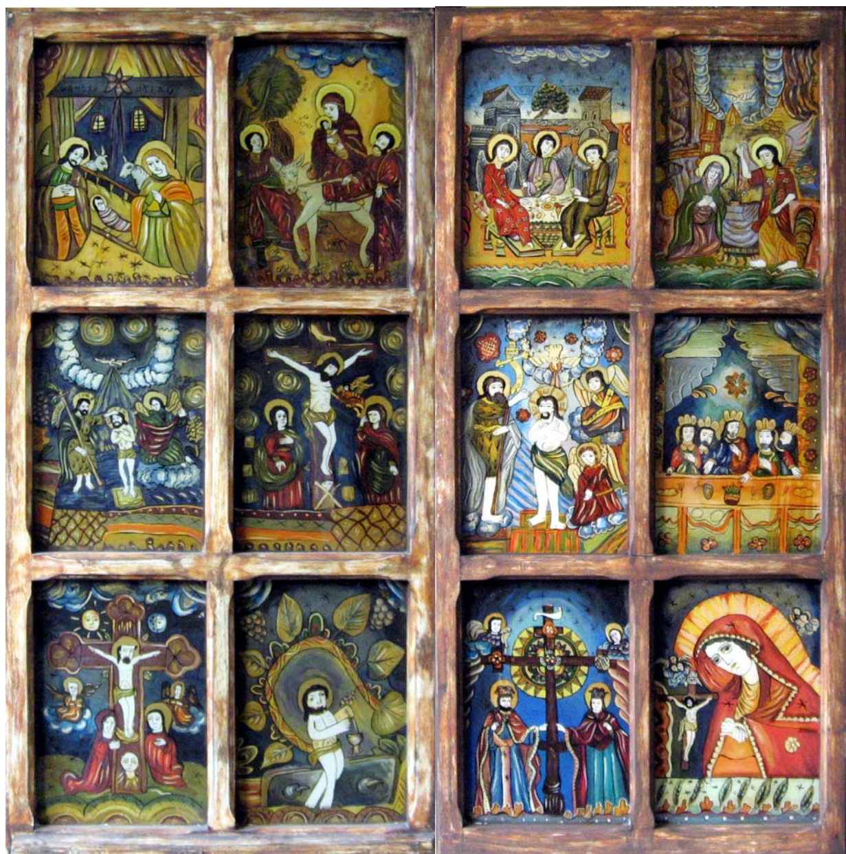
„ICOANA DIN FEREASTRĂ” – ICOANA ÎNTRE TRADIȚIE ȘI MODERNITATE

* Serie veche nouă* Anul I, nr. 2, aprilie 2009