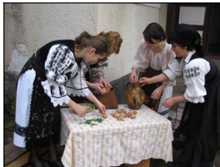
Pâinea Paștilor și vopsitul tradițional al ouălor cu foi de ceapă la Deda (aprilie 2006)