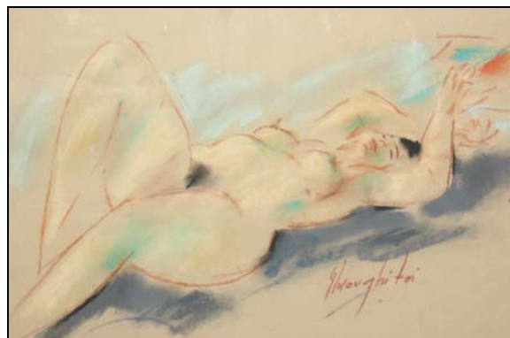
V. Gheorghita – Nud, Colecția Nicolae Băciut