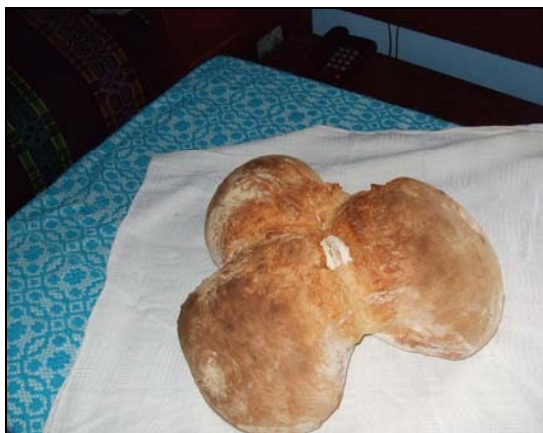
Pâinea Paștilor la Sînmihaiu de Pădure (aprilie 2008)

Aceste zile premergătoare sînt rezervate și unor rituri de purificare, de sîmbătă pînă luni, bătrînele satului nu mănîncă nimic. Este așa-numitul „post negru” care durează pînă după sfințirea Paștilor. În noaptea de sîmbătă spre duminică, în biserici se face slujba Învierii. Se