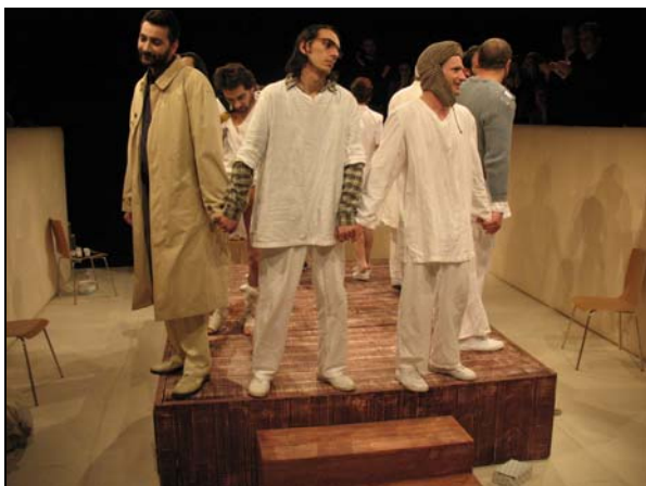
Moment final din „Nebunul și floarea”, spectacol după romanul omonim al lui Romulus Guga (Teatrul Național din Târgu-Mureș, 14 mai 2008)