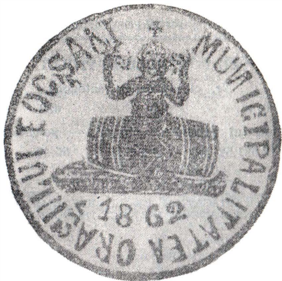
Simbolul heraldic al municipalității orașului Focșani, 1862.