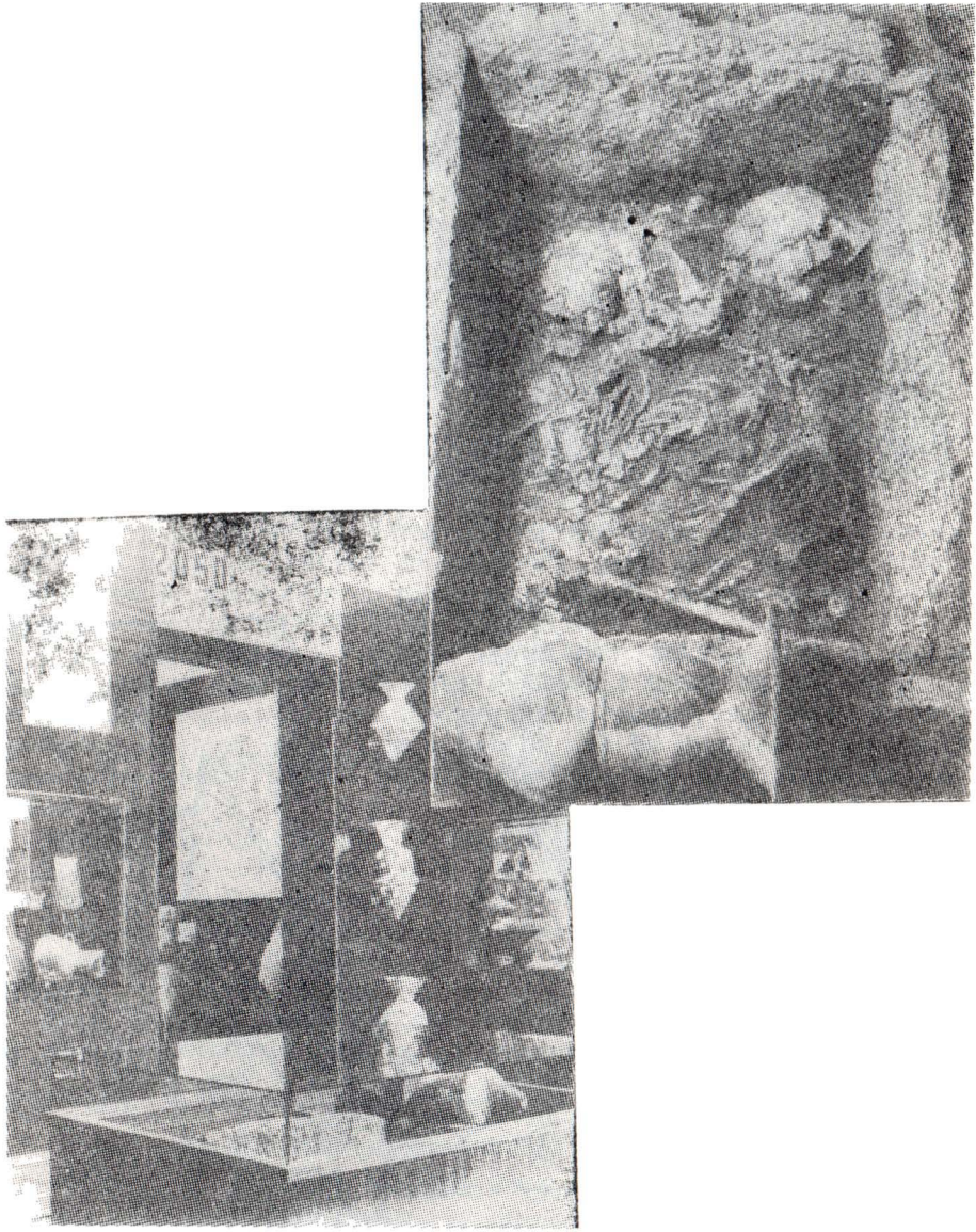
Fig. 3, Mormintul http://cine.ro http://muzeul.ro si in productie in circuit.