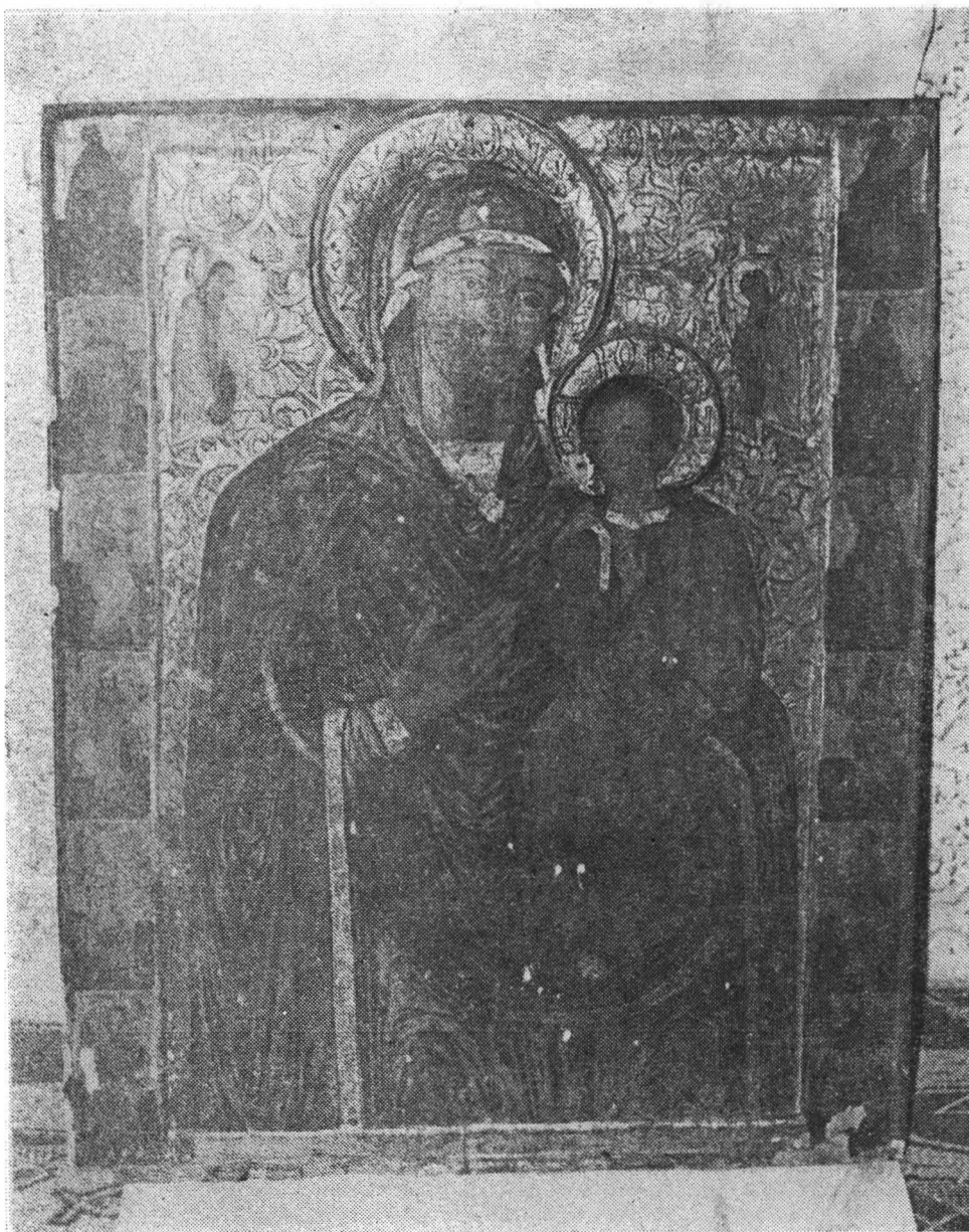
Fig. 5 — Icoana „Maica Domnului cu pruncul” (tipul Hodighitria).