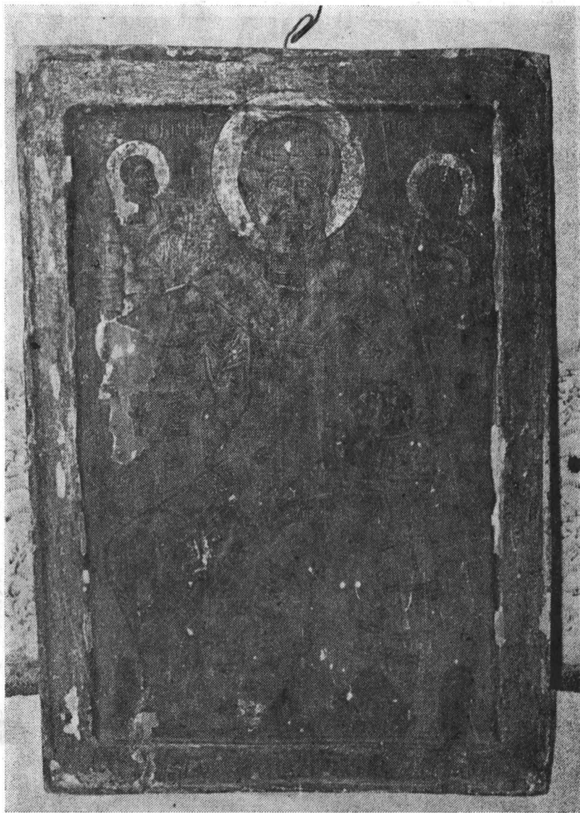
Fig. 4 — Icoana „Sfintul Nicolae“.