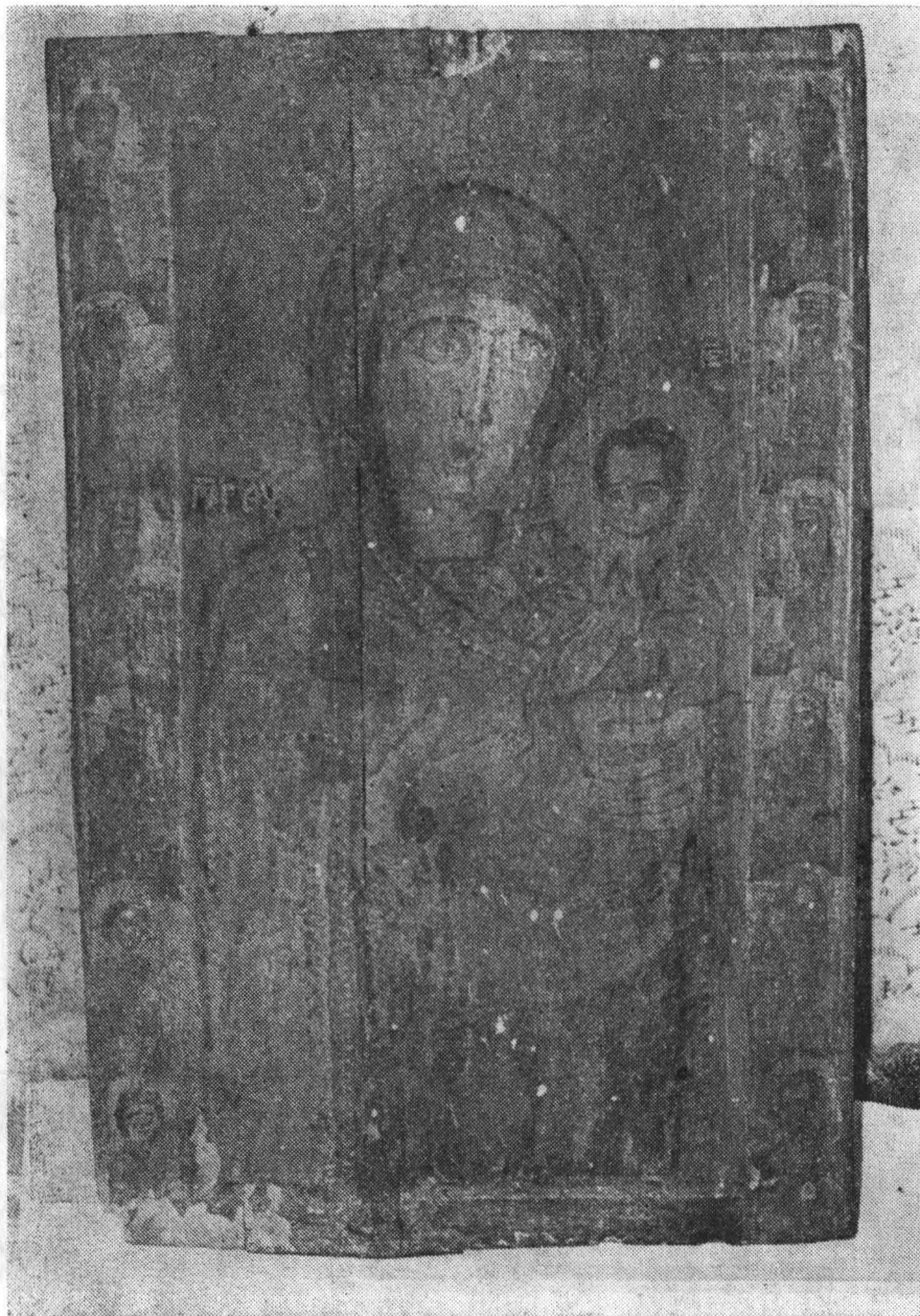
Fig. 3 — http://cimec.ro / http://muzeulvrancei.ro (Iona, Hedighitria).